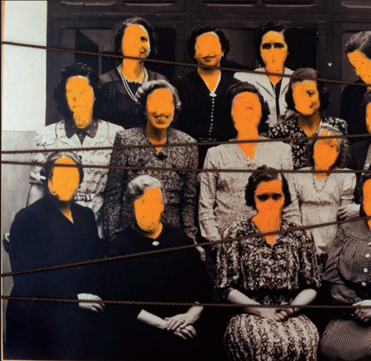
Carmen Calvo, Una vida de Mercurio , 1999. Tècnica mixta, collage, fotografia. 105 x 155 cm.