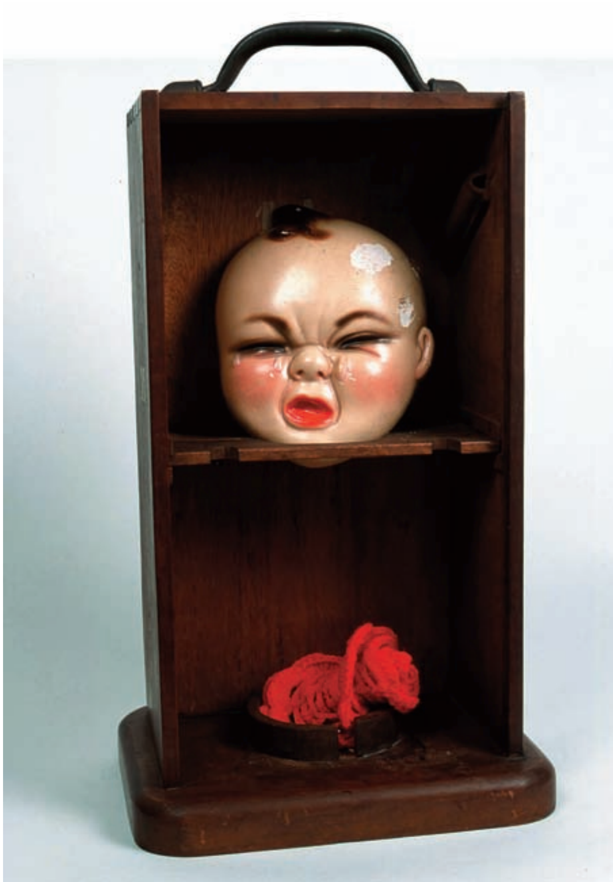
Carmen Calvo, Naranjas de la China , 2001. Tècnica mixta, collage. 39 x 17 x 23 cm.