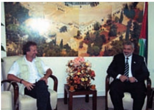
Aquesta foto de l'entrevista que mantingué Scott Atran amb el primer ministre palestí, Ismail Haniyeh, va ser presa tan sols una estona abans que l'estança fos bombardejada i semidestruïda per l'exèrcit israelià.