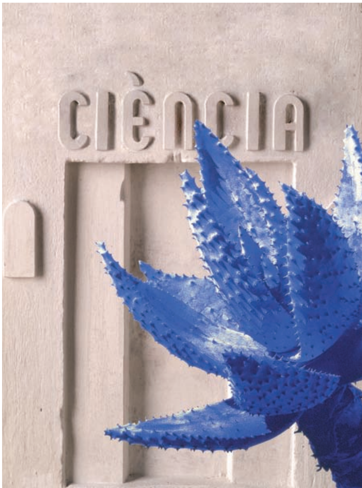
Miquel Navarro. Cactus ciència I , 2009. Collage escultòric, 21 x 28 cm.