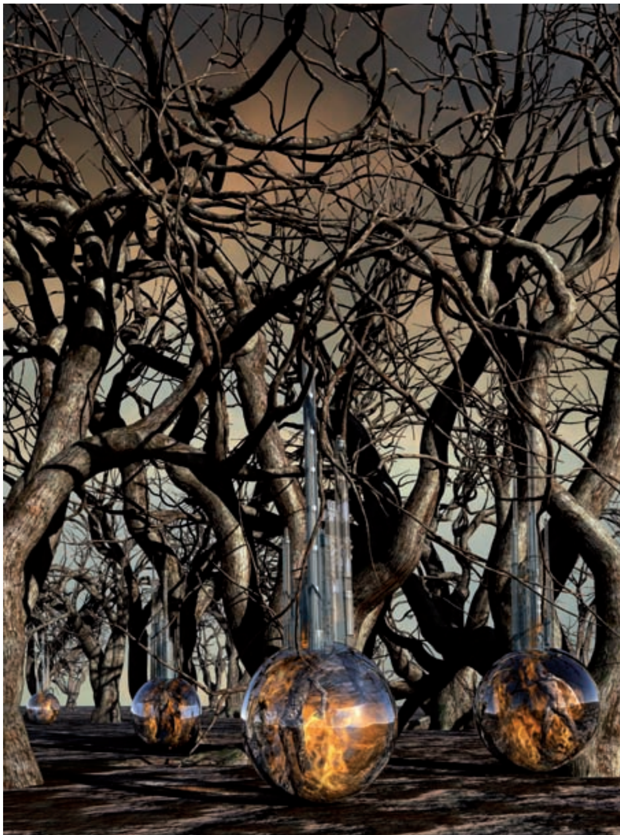
Marina Núñez. Sense títol , 2008. Sèrie Ciència-ficció. Infografia en caixa de llum, 150 x 200 cm.