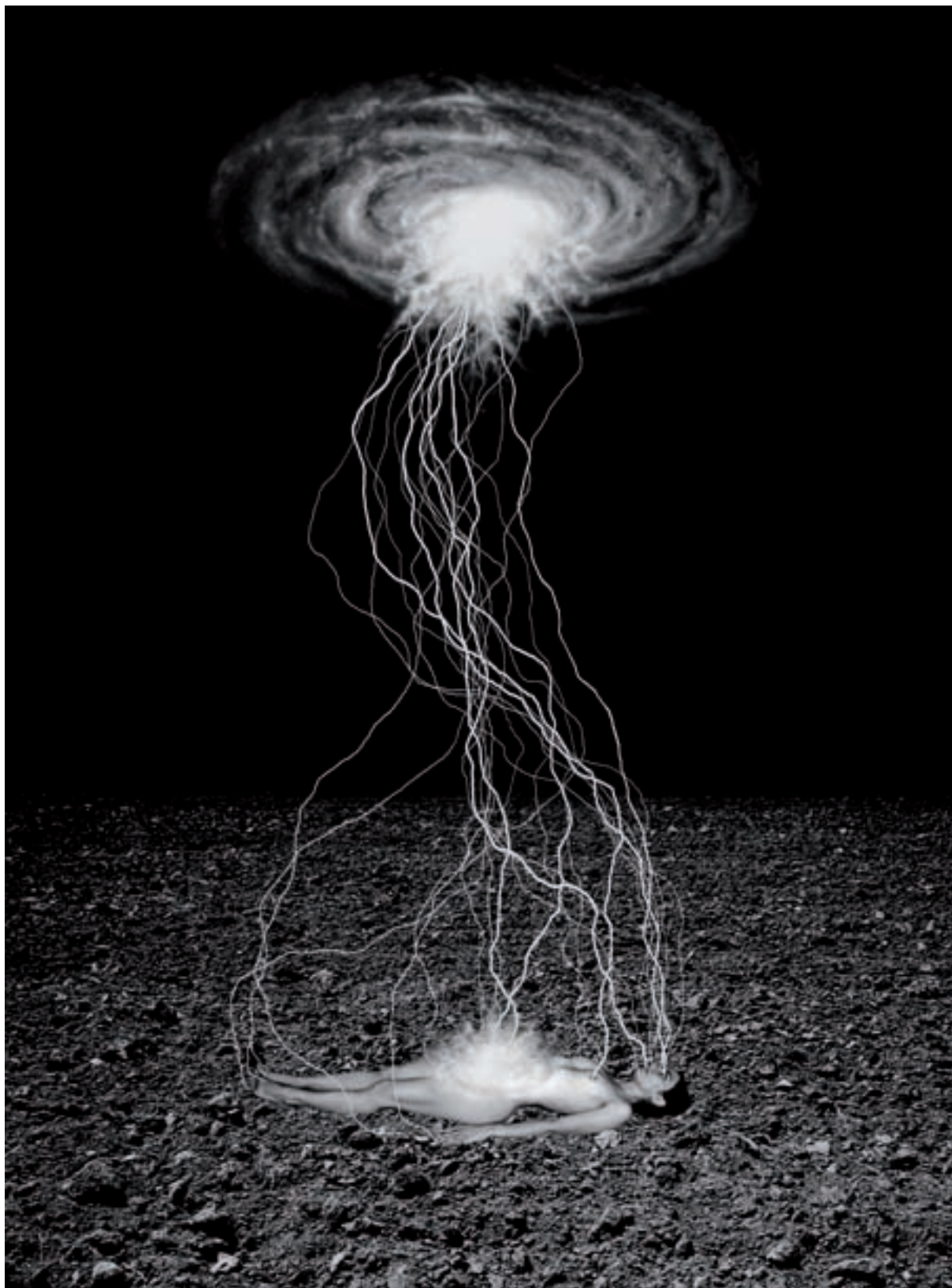
Marina Núñez. Sense títol , 2001. Sèrie Ciència-ficció. Infografia i retolador sobre paper, 67 x 48 cm.