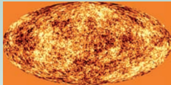
Mapa simulat de les temperatures del CMB que veurà el Planck sobre l'esfera celeste.