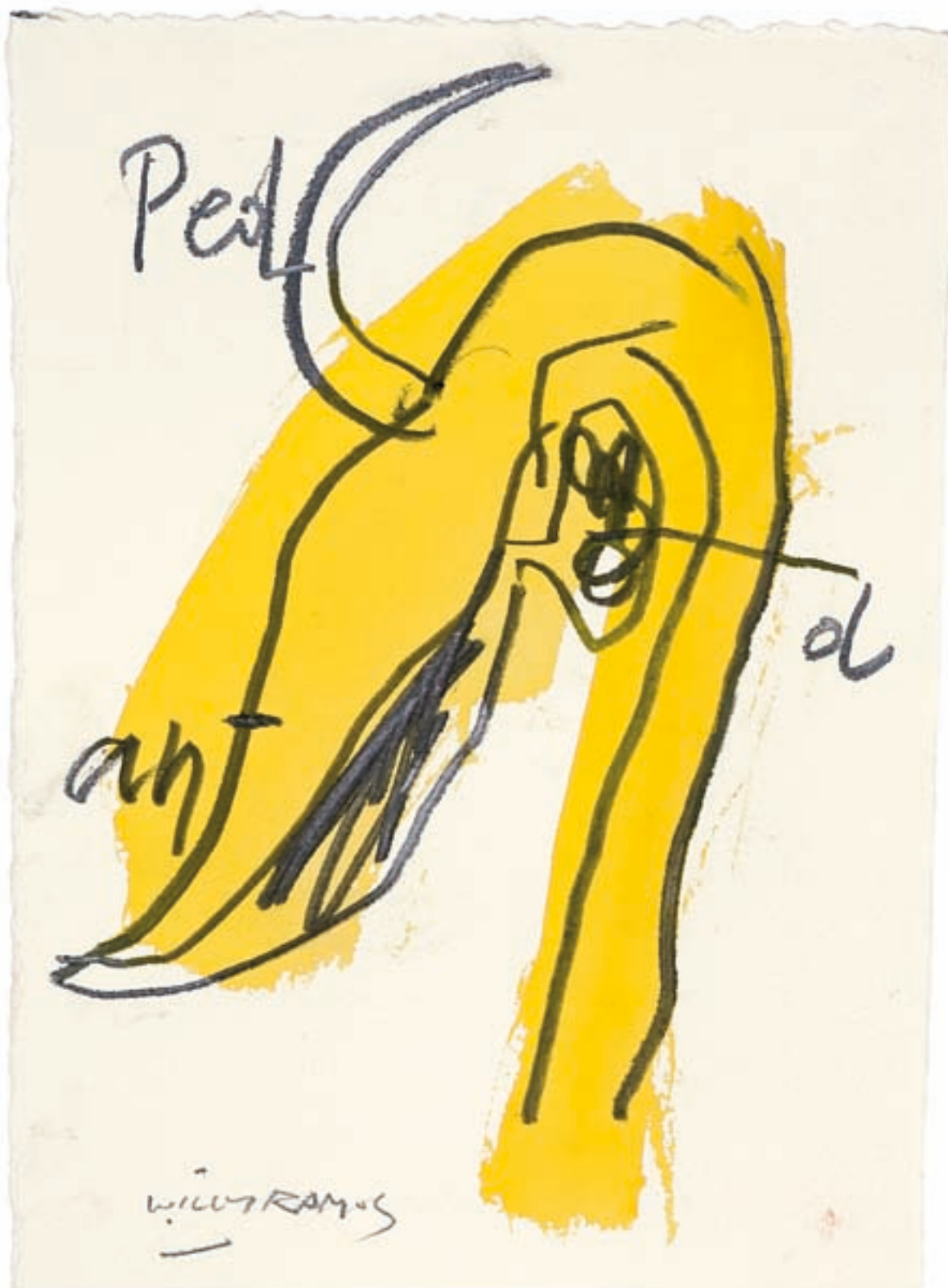
Willy Ramos. Morfologia , 2008. Sèrie «L'evolució del color». Grafit i aquarel·la, 18,5 x 28,5 cm.