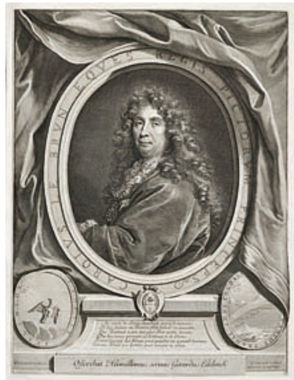
Gravat de Charles Le Brun per Gerardus Edelinck, de l’escola flamenca.

El segle XVII fou clau en la història de la cultura francesa. Fou el segle de Lluís XIV, el rei Sol, el qual esmerçà una fortuna immensa per tal de fabricar una monarquia absoluta i glorificar-la. Entre d’altres col·laboradors, precisà d’un pintor al servei estricte d’aquests objectius, i Charles Le Brun (1619-1690) li vingué com l’anell al dit. Posseïa un talent extraordinari, tant artístic com organitzador, i com a primer pintor de Lluís XIV i director de l’Acadèmia de Pintura i Escultura, fou l’artífex o el supervisor de gairebé totes les produccions pictòriques encarregades pel govern reial, d’entre les quals destaquen les del Palau de Versalles.