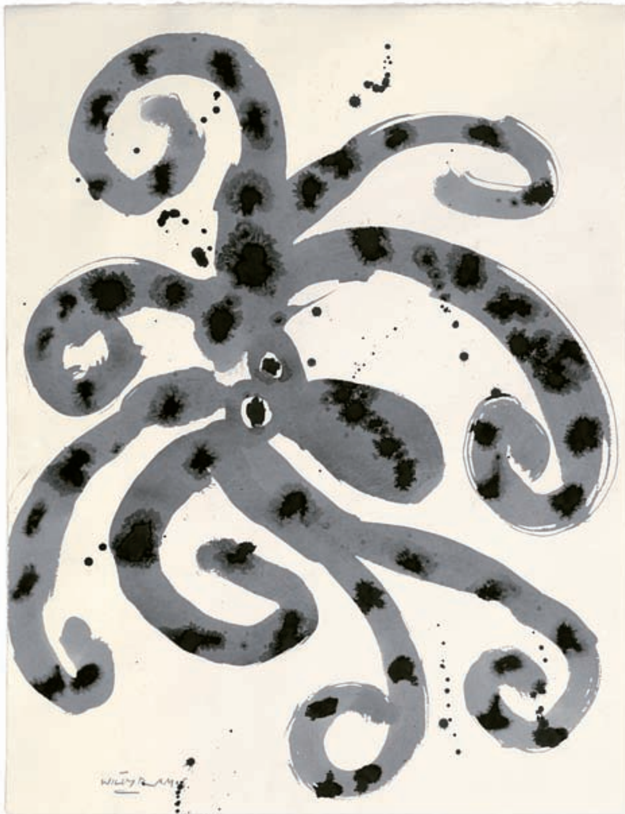
Willy Ramos. Polp , 2008. Sèrie «Evolució del color». Aquarel·la, 50 x 65 cm.