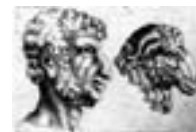
Dibuix que compara l'home amb el moltó extret del llibre De humana physiognomonia de Gianbattista della Porta (1598).

En qualsevol cas, les làmines apunten a un interès profund de Le Brun per definir quantitativament la morfologia d'un rostre, i poder-lo caracteritzar de manera sistemàtica. En això s'avança un segle als treballs de comparació quantitativa de l'home amb els animals de Petrus Camper i del seu famós angle facial, i en gairebé tres-cents anys a la definició geomètrica de les formes i les transformacions cartesianes de D'Arcy Thompson. Le Brun, però, probablement no s'interessà mai per esbrinar el caràcter de les persones a través del seu rostre, com volia Della Porta. A Le Brun li interessava més aviat el contrari; donat un caràcter, una emoció, una passió, vol esbrinar com caldria pintar-la. Al cap-