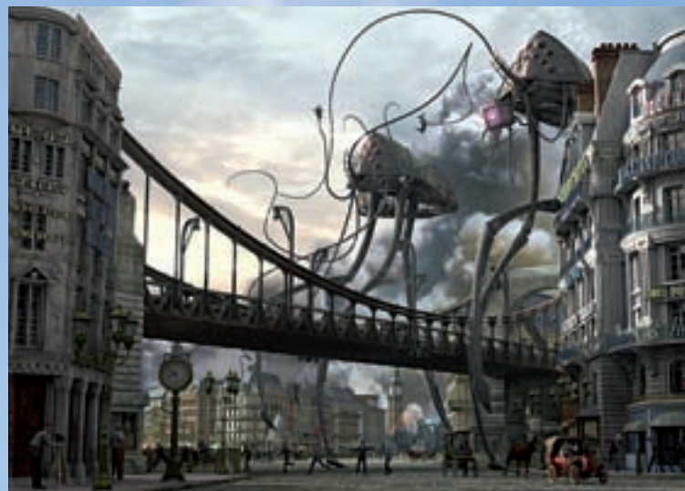
La novel·la d'H. G. Wells, La guerra dels mons , narra una invasió alienígena de la Terra. En la il·lustració, els trípod extraterrestres imaginats per Wells ataquen Londres.

«SEGONS HAWKING, CORREM EL RISC QUE, EN DELATAR LA NOSTRA PRESÈNCIA, ÉSSERS EXTRATERRESTRES VINGUEN A ENVAIR-NOS I A APODERAR-SE DELS NOSTRES RECURSOS, DESTRUÏNT EN EL PROCÉS LA RAÇA HUMANA»