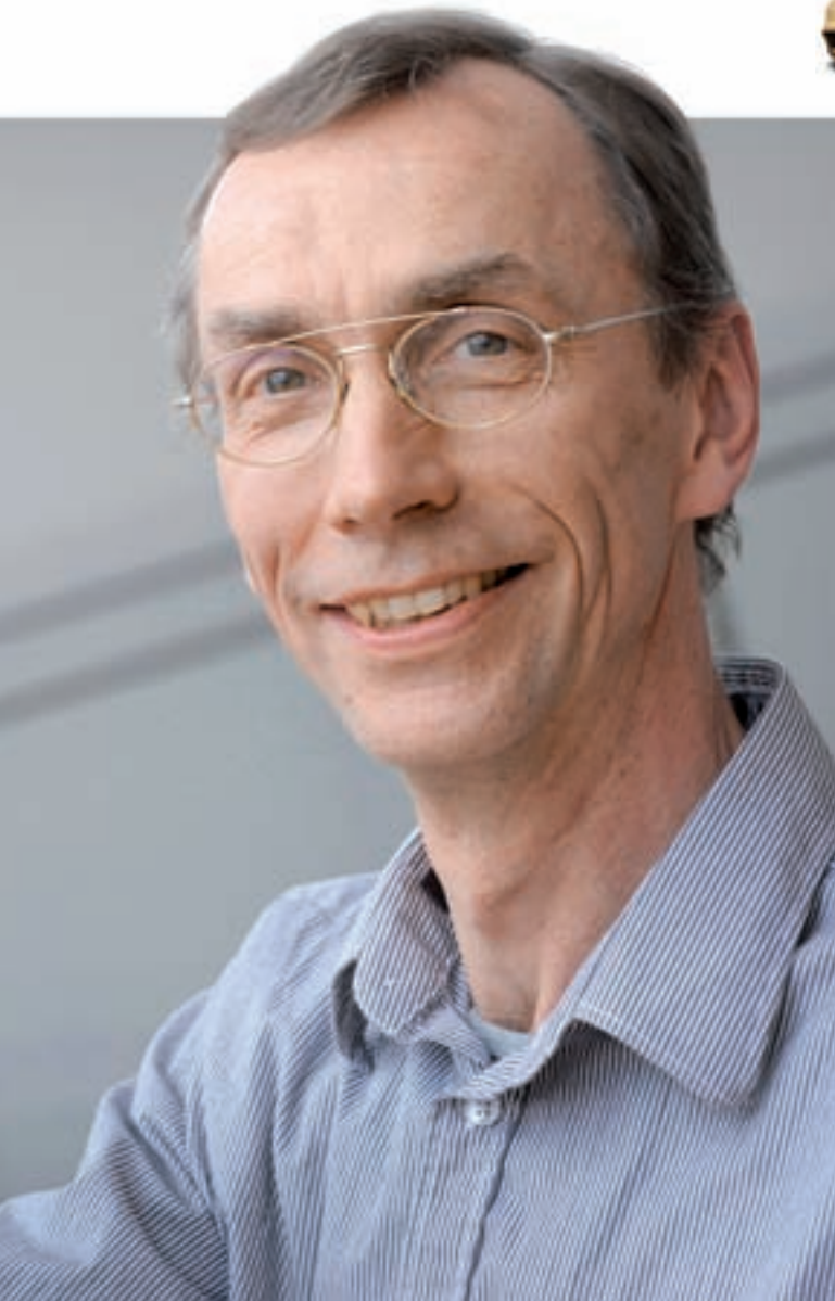
L'investigador Svante Pääbo, amb la reconstrucció d'un crani neandertal. El científic de l'Institut Max Planck, un dels més reconeguts experts en ADN fòssil, ha liderat el Projecte Genoma Neandertal, del qual es presentaren les conclusions el passat mes de maig.

«ELS RESULTATS DEL PROJECTE CIENTÍFIC NO S'AJUSTEN A CAP DE LES DUES HIPÒTESIS QUE S'HAN FORMULAT SOBRE L'ORIGEN I EVOLUCIÓ DE LA NOSTRA ESPÈCIE. ES TRACTA D'UNA TEORIA NOVA DE L'EVOLUCIÓ HUMANA»