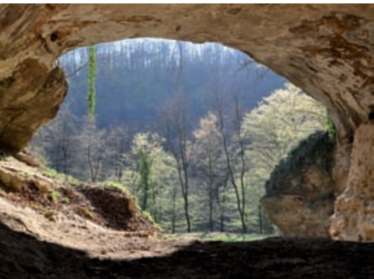
Entrada de la cova de Vindija, a Croàcia. Els ossos utilitzats per elaborar l'esberrany genòmic del neandertal han estat trobats en aquest jaciment.

la de categoritzar com a «exclusiu d'humà modern» variants gèniques que en realitat podrien haver estat presents en altres espècies extingides d'hominí. Això introduiria un biaix conceptual en la nostra comprensió de la naturalesa humana, perquè ens interessin precisament aquelles variants presents només en la nostra espècie.