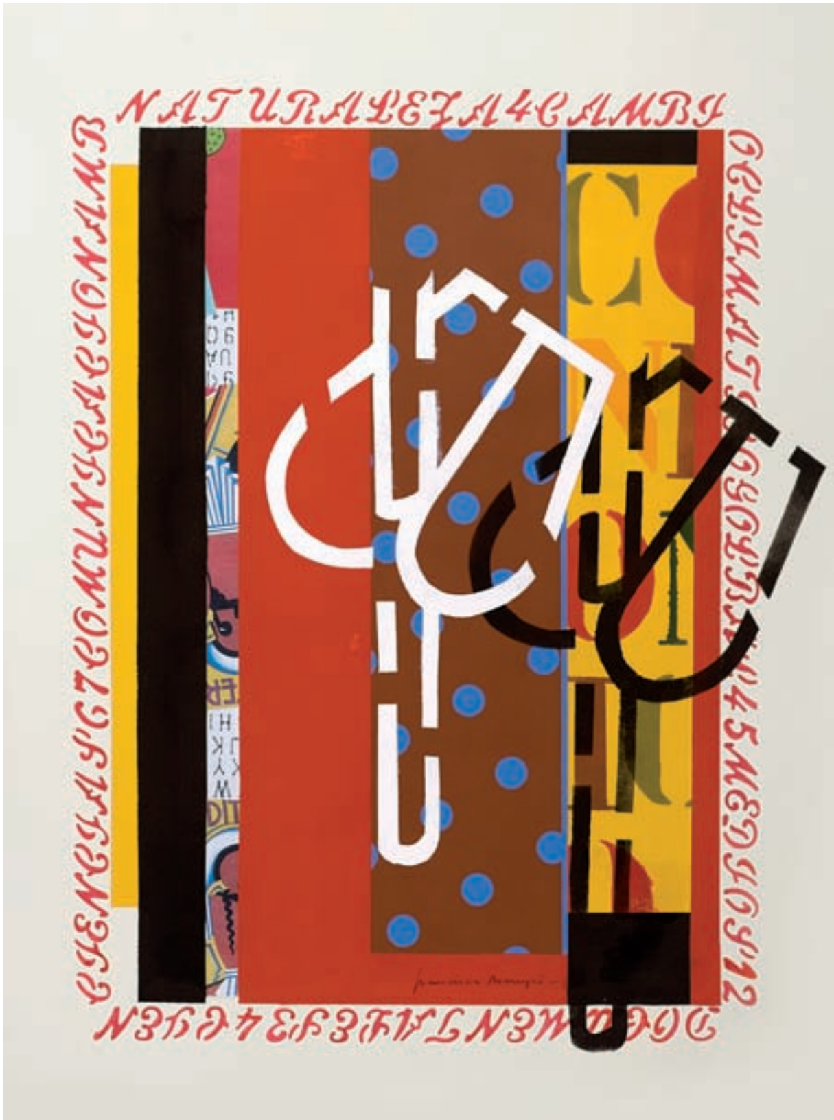
Francisca Mompó. Doble fulla , 2010. Sèrie «Botànic». Guaix, collage sobre paper, 70 x 100 cm.