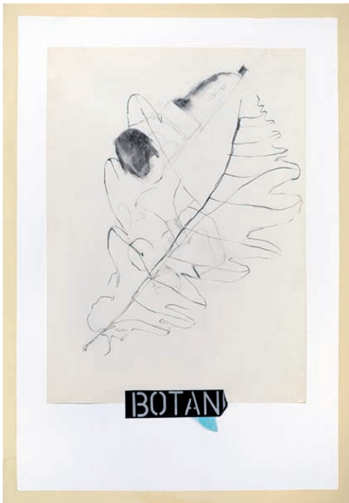
Francisca Mompó. Del natural , 2010. Sèrie «Botànic». Grafit, collage sobre paper, 50 x 70 cm.