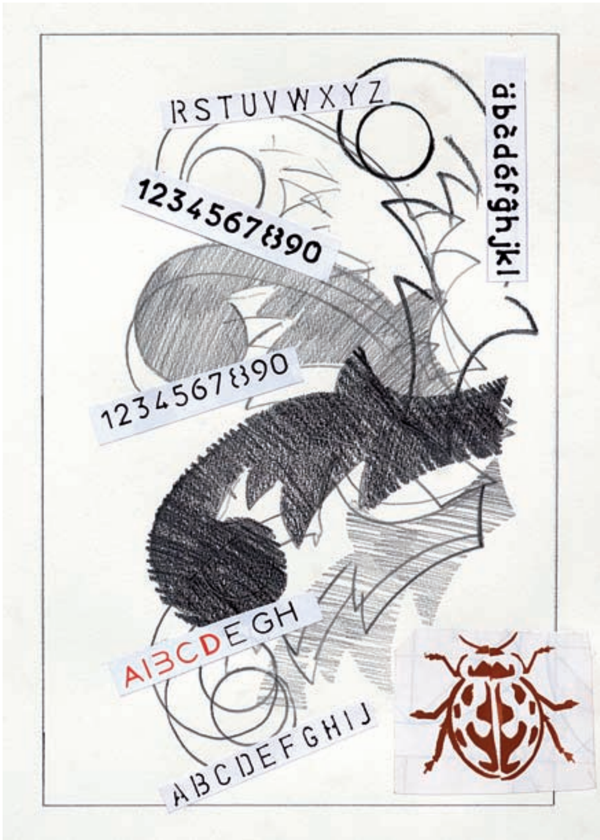
Francisca Mompó. Informe vegetal , 2010. Sèrie «Botànic». Grafit, collage sobre paper, 30 x 41 cm.