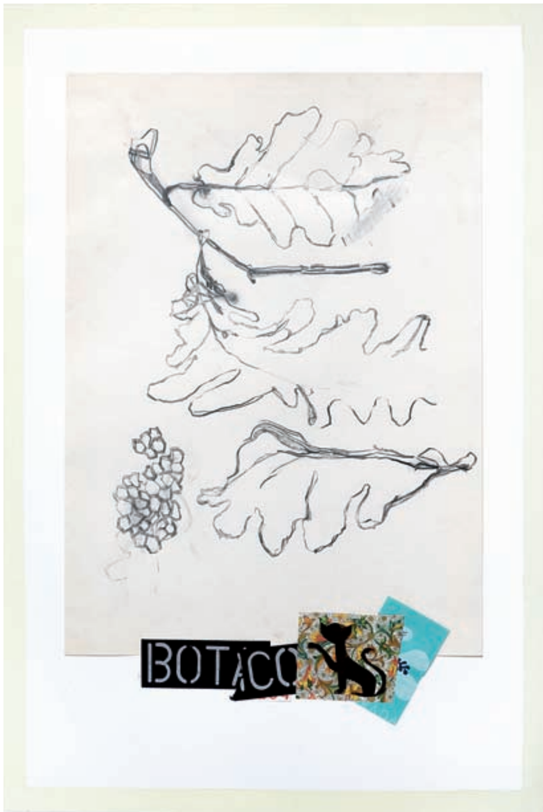
Francisca Mompó. Estreta relació , 2010. Sèrie «Botànic». Grafit, collage sobre paper, 50 x 70 cm.