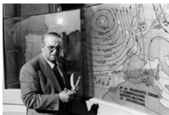
A dalt, dues fotografies de Mariano Medina, en les primeres emissions a Televisió Espanyola. Medina va ser el primer home del temps espanyol, des de les primeres emissions del mapa del temps de TVE el 1956.