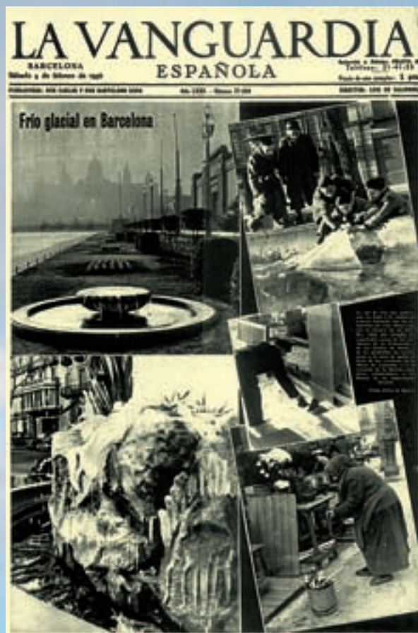
Portada del diari La Vanguardia de Barcelona del 4 de febrer de 1956, en plena invasió d'aire polar. Catalunya, per la seua orientació geogràfica en el nord-est peninsular, va rebre de ple les masses d'aire glacial.

Una de les causes fonamentals de la suavitat tèrmica que ha caracteritzat la majoria dels hiverns a Espa-