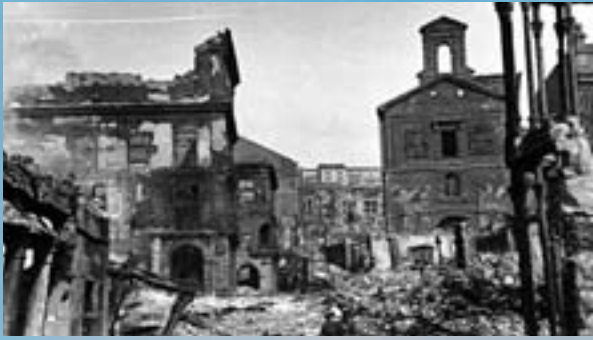
El centre històric de Santander, destruït després de l'incendi que va arrasar 37 carrers. El foc va ser avivat pel vent huracanat associat a una borrasca amb 950 mil·libars al seu centre.