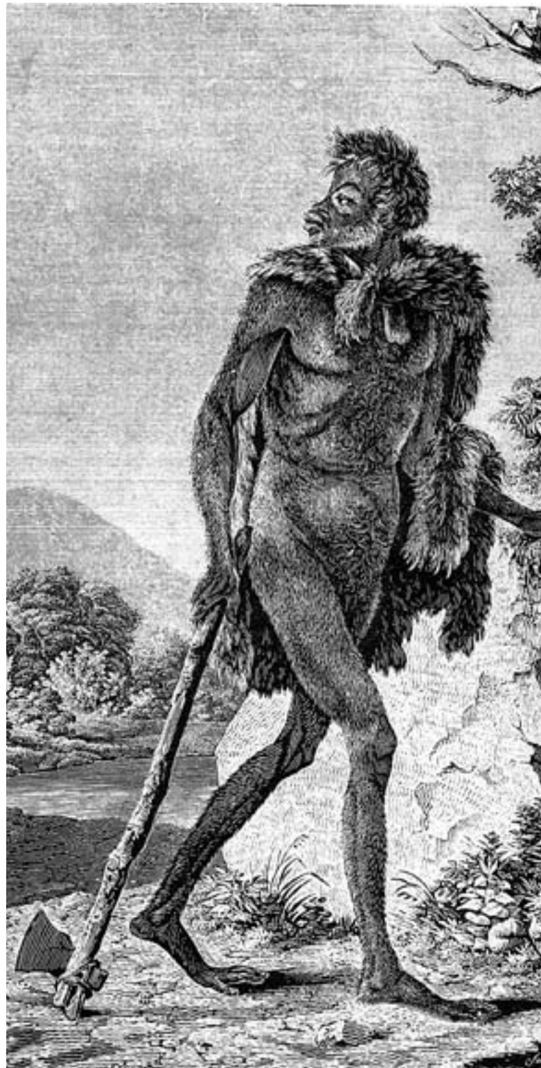
Primera representació de «l'Home fòssil», deguda a Pierre Boitard el 1838. Presenta trets morfològics suposadament similars als de tipus humans de pobles centreafricans i del Carib i als d'aborígens antics del Perú i Xile.

La polèmica va desbordar l'àmbit científic. A França, cercles espiritualistes van invocar, en presència