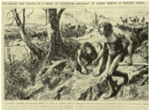
Imaginària representació de l' Hesperopithecus construïda després de la troballa d'una dent fòssil que posteriorment es va identificar que pertanyia a un pècari, mamífer emparentat amb els porcs.