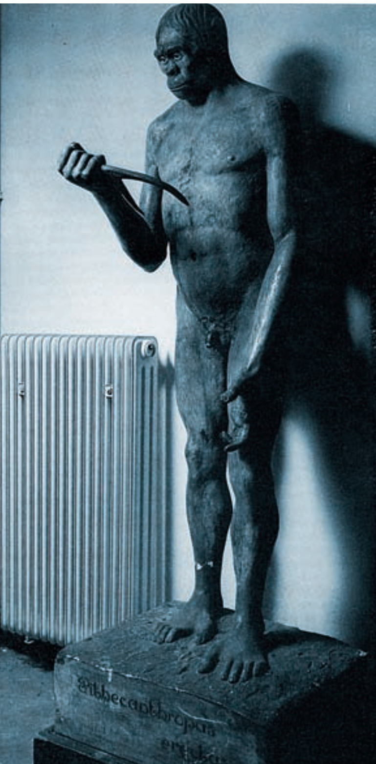
Representació del Pithecanthropus erectus a partir de les restes fòssils trobades per E. Dubois a Java.