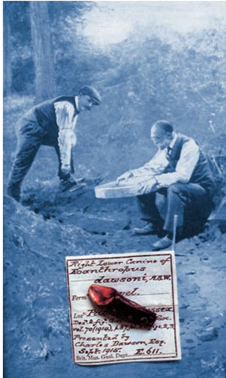
Excavació a Piltdown i caní inferior dret de l' Eoanthropus dawsoni .