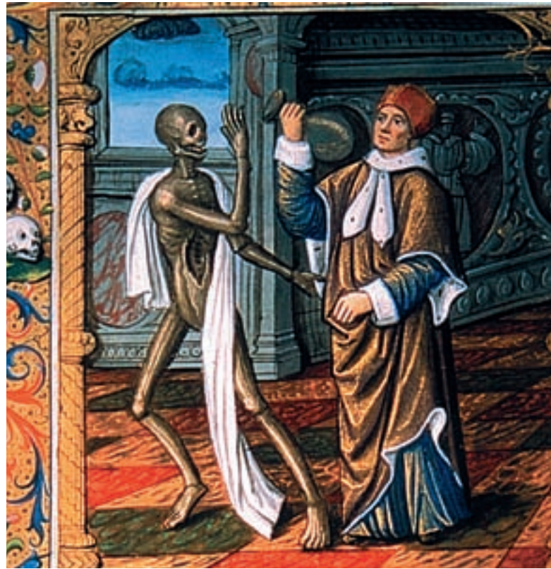
Un ric i reeixit físic vestit amb robes luxoses examina un flascó d'orina. Però ni ell mateix pot evitar la visita de la mort (Bibliothèque Nationale, París, ms. Français 995, f. 11v.; La Danse Macabre , segle xv)

la societat del moment. Eren aquells que, amb una formació acadèmica centrada en el galenisme, dominaven els continguts doctrinals i podien explicar la causa de les malalties i tractar-les en conseqüència, feien els diagnòstics a partir de l'observació de l'orina i la presa dels pols dels malalts, una tasca que es podia fer ben vestit i endreçat, car la part de l'acció manual era reservada normalment als barbers, cirurgians i apotecaris.