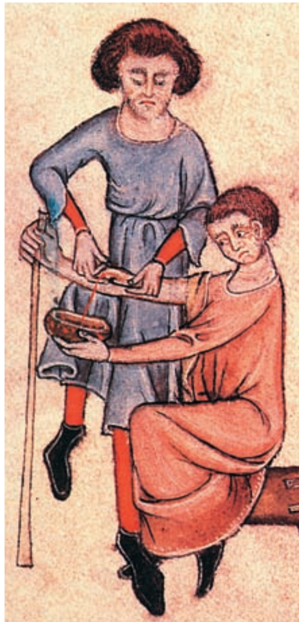
Un barber-cirurgià practica una flebotomia o sagnia terapèutica a un pacient ( Saltiri de Lutrell , c. 1340. British Library, ms. Add. 42130, f. 61r)

Un dels tòpics historiogràfics més habituals ha estat el de la figura del jueu usurer. En bona mesura, l'increment dels coneixements sobre els hebreus medievals ha fet que se'n difongués una imatge més completa, de la qual emergeix el jueu metge. Ara bé, ni tots els jueus foren prestadors ni tampoc metges, si bé és quasi impossible trobar a la Corona d'Aragó una