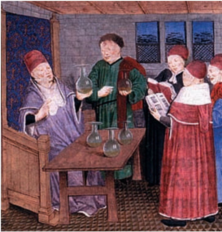
L'examen de l'orina constituí una de les principals eines de diagnòstic i pronòstic a l'abast dels practicants de la medicina ( Des Proprietez des Choses , traducció del tractat de l'enciclopèdia mèdica de Bartholomeus Anglicus, segle xv. British Library, Cottonian Ms. Augustus AVI, f. 66r.).