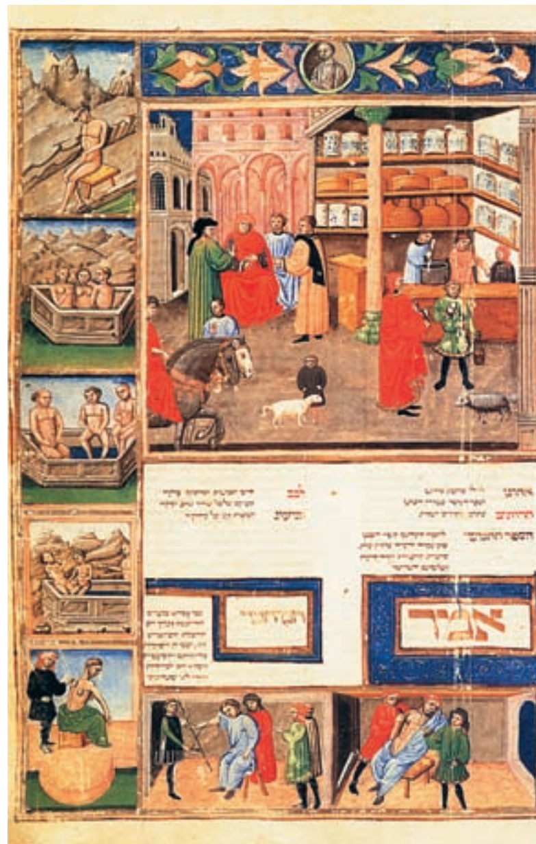
Obrador d'apotecari obert al carrer en una ciutat medieval. Al voltant es poden apreciar diverses escenes de tractaments mèdics (manuscrit hebreu del Canon d'Avicenna, copiat a Itàlia a finals del segle xv. Bolonya, Biblioteca Universitària, ms. 2197, f. 492r)

«ELS APOTECARIS FABRICAVEN MEDICAMENTS ATENENT A LES RECEPTES EMESES PELS FÍSICS, TOT I QUE LA GAMMA D'ACTIVITATS DE CARÀCTER ARTESANAL I MERCANTIL QUE PODIEN DESENVOLUPAR ERA AMPLÍSSIMA»