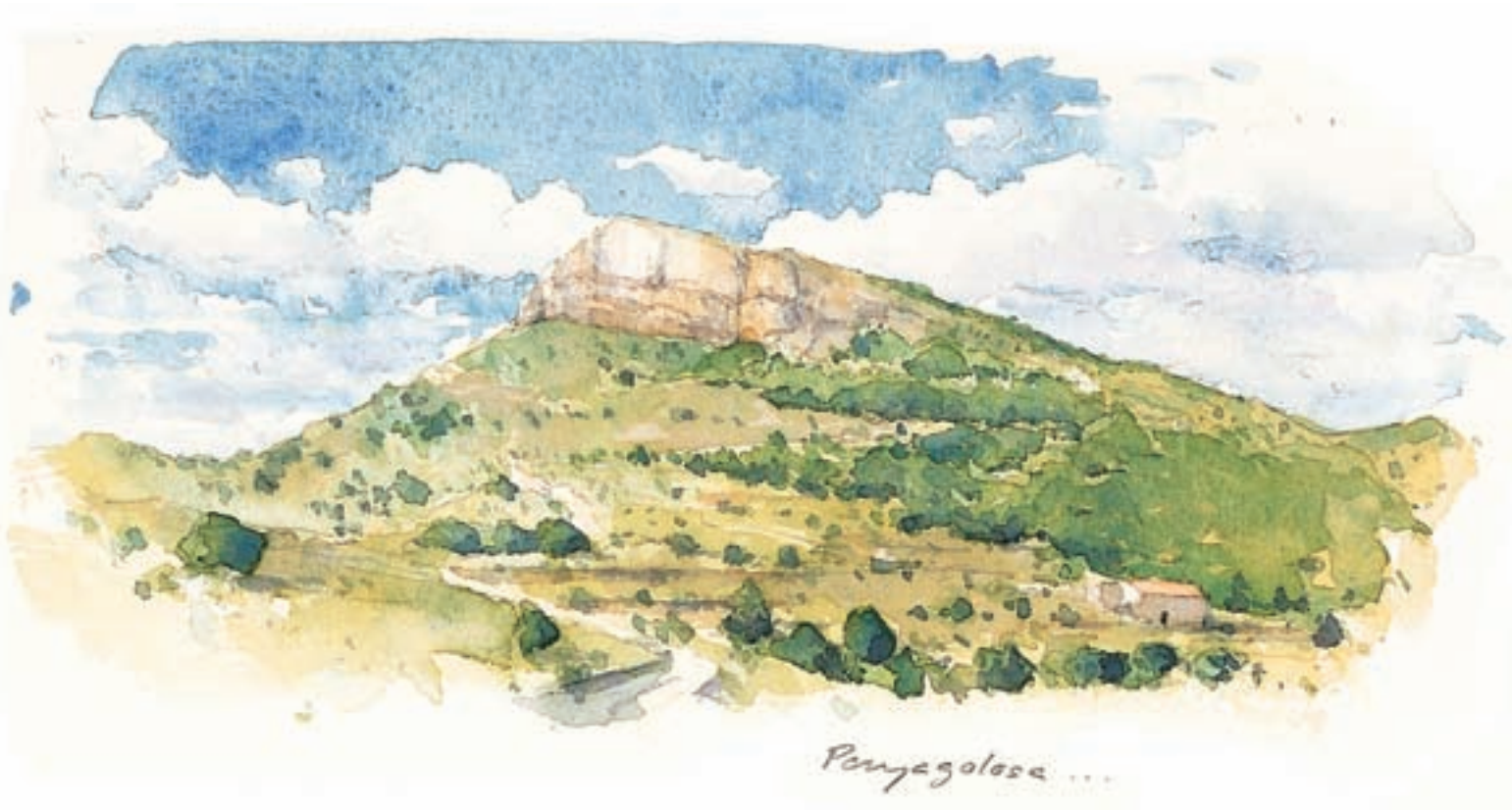
Javier Chapa. Penyagolosa , 2006. Aquarel·la sobre paper, 24 x 14 cm.

nitzats sinó, també, els voltants dels pobles i els masos. La circulació lliure de vehicles tot terreny, incloent-hi motos i quads, genera impactes encara no avaluats però, en qualsevol cas, considerables sobre els ecosistemes. I la concentració dels visitants en uns pocs llocs, així com la freqüentació de determinades rutes, pot arribar a causar impactes greus. Una bona ordenació i una gestió sostenible del territori pot conjurar aquestes amenaces. Per desdichat, l'extensió reduïda del parc dificulta l'eficiència d'aquesta gestió.