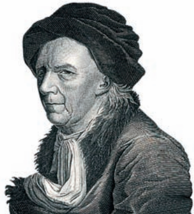
El gran matemàtic Leonhard Euler.

«AMB ELS SEUS 873 LLIBRES I MEMÒRIES, EULER ÉS CONSIDERAT COM UN DELS MATEMÀTICS MÉS PROLÍFICS DE LA HISTÒRIA»