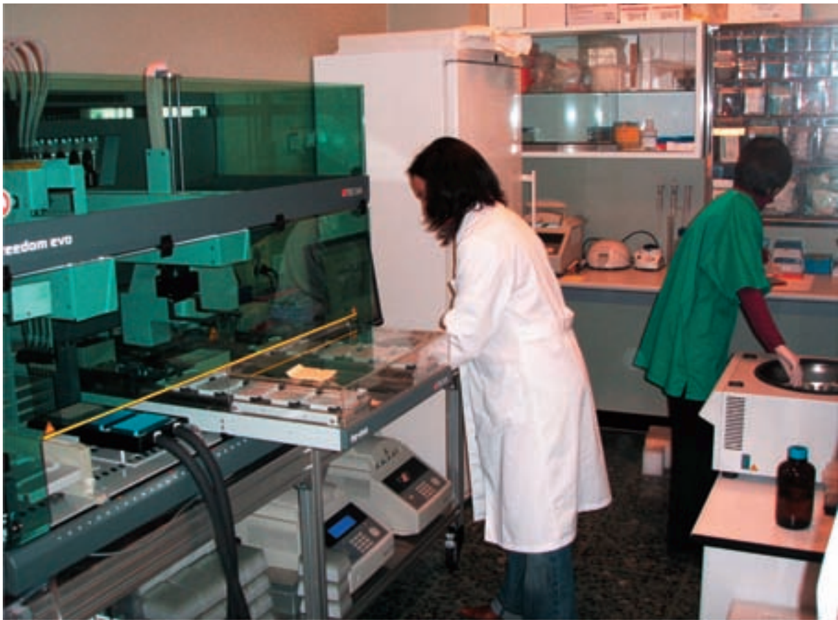
La majoria dels laboratoris de genètica forense fan servir a hores d'ara el DNA mitocondrial, sent el seu major problema el control de la contaminació i la valoració estadística.

condicions en què el material biològic a analitzar es troba en mal estat o en quantitat insuficient per a estudiar qualsevol altre marcador nuclear.