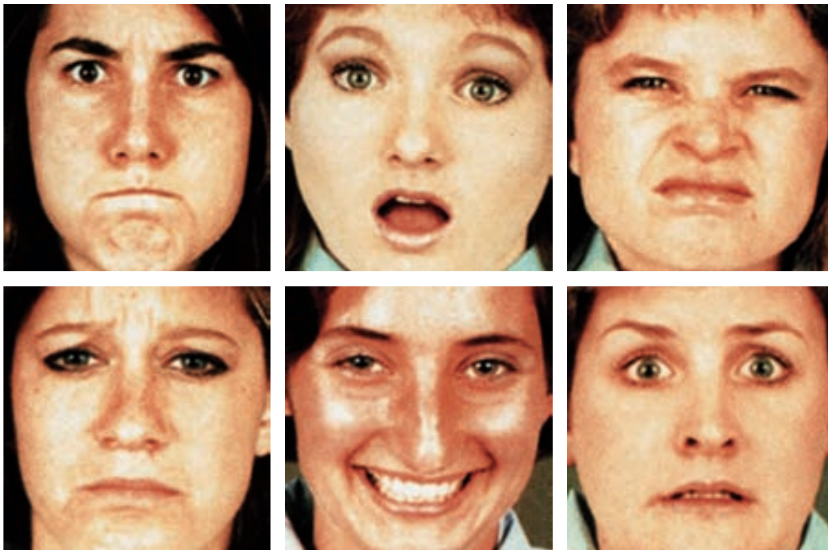
Expressió d'emocions. En el seu llibre L'expressió de les emocions en els animals i en l'home , Darwin va anotar el valor universal d'aquestes expressions i, per tant, del seu fonament genètic. En l'autisme, aquestes expressions solen estar particularment subdesenvolupades.