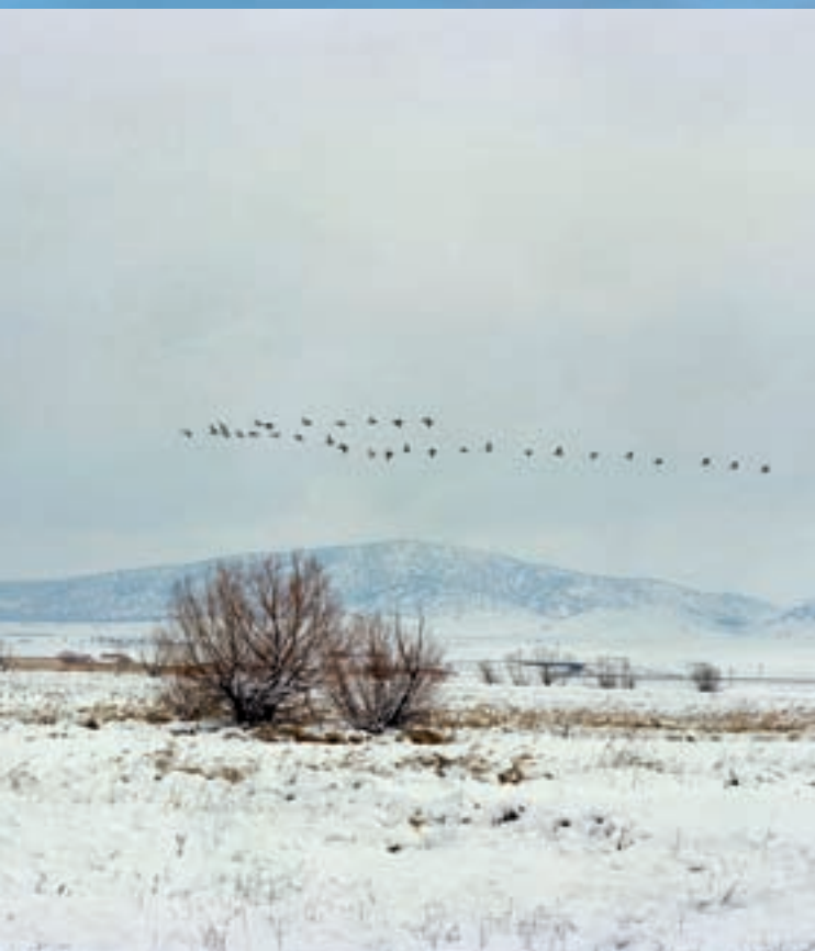
Panoràmica de la vall del Jiloca (Terol) després d'un temporal de neu en febrer de 2006.