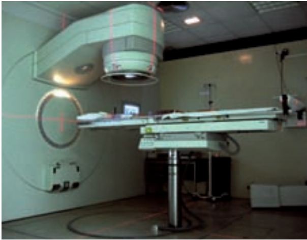
Accelerador lineal d'electrons de l'Hospital Universitari La Fe (València). Pot girar al voltant de la llitera, la posició de la qual s'ajusta exactament amb un sistema de làsers (llums vermells).

de transport. Inclou el ciclotró i els sistemes de selecció d'energia i de transport del feix. El ciclotró de protons té una energia fixa de 230 MeV, i mitjançant un reductor variable d'energia s'obté l'energia necessària per a cada tractament (de 230 a 70 MeV). En un sincrotró no és necessària aquesta operació, perquè l'energia del feix és variable. Un sistema de transport connecta la zona de selecció d'energia amb el punt d'entrada de cada sala i permet proporcionar un feix centrat, amb les propietats adequades per a la zona experimental o de tractament.