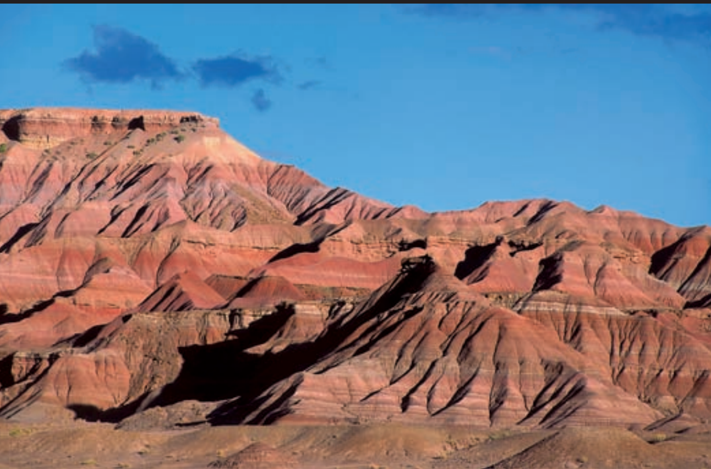
Desert pintat, al desert de Sonora, Arizona (Estats Units).

Fotografia de paisatge en què interessa que hi hagi qualitat en tots els punts, de manera que un poder de resolució desequilibrat produiria diferències apreciables entre el centre i les cantonades. Per tant, es va escollir un f/11 perquè fos ben equilibrat, amb una nitidesa raonable i força profunditat de camp.