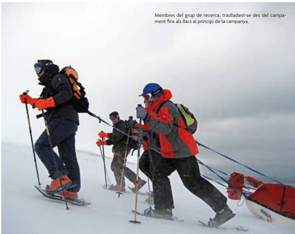
Membres del grup de recerca, traslladant-se des del campament fins als llacs al principi de la campanya.