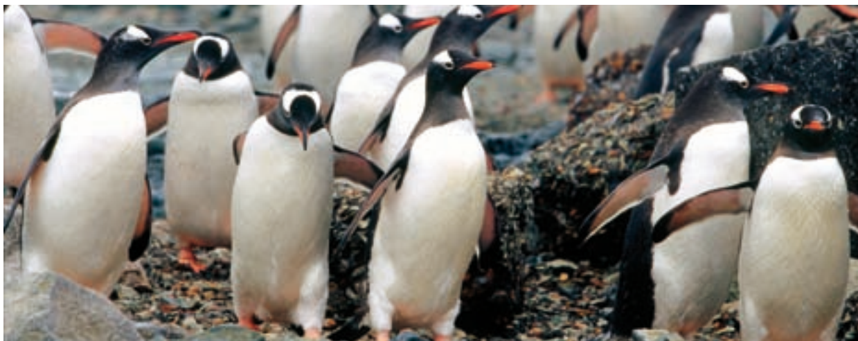
Un grup de pingüins de Papua o de corona blanca ( Pygoscelis papua ) a l'illa Danco, tornant del seu bany.

Les regles que els operadors turístics de l'Antàrtida es van imposar per conservar el medi ambient estableixen, entre moltes altres coses, que no poden desembarcar més de cent passatgers al mateix temps. Aquest és el motiu pel qual els creuers són petits i hi regna un ambient realment amigable, ja que tothom es coneix al segon dia de navegació.