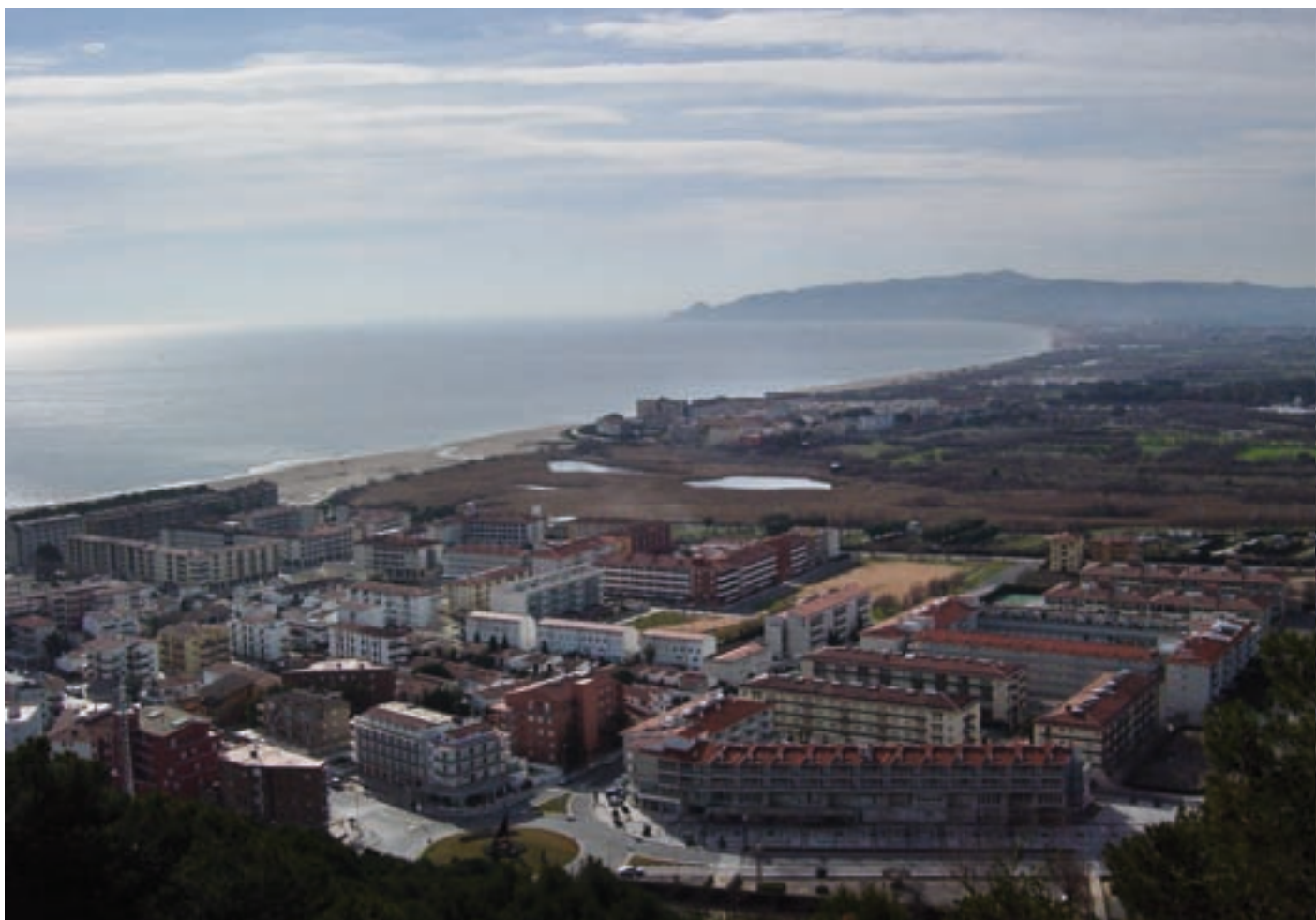
Paisatge de la plana del Baix Ter (Comarques Gironines).

complexes com els imaginaris futurs o les propostes per al paisatge. L'experiència va resultar molt satisfactòria des del punt de vista tècnic, però també ho va ser per als participants.