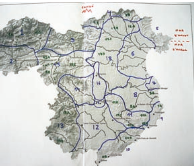
Proposta d'unitats de paisatge a partir de les entrevistes a agents de paisatge.

Les persones convidades a aquestes sessions van treballar durant tres trobades consecutives i van anar aproximant-se al paisatge de manera successiva. En la primera sessió es descrivia conjuntament el paisatge, en la segona es posava l'èmfasi en els valors paisatgístics i en la tercera es proposaven criteris per assolir el bon estat del paisatge. Fer diverses sessions permetia obtenir un volum d'informació major i, sobretot, assolir una dinàmica grupal que generava resultats de més alta qualitat tècnica i més sòlids socialment. El grau de reconeixement mutu creixia a cada trobada i, en un ambient més relaxat, era més senzill distingir quins eren els acords, desacords i dubtes que despertava cada espai. La maduresa com a grup propiciava tasques més