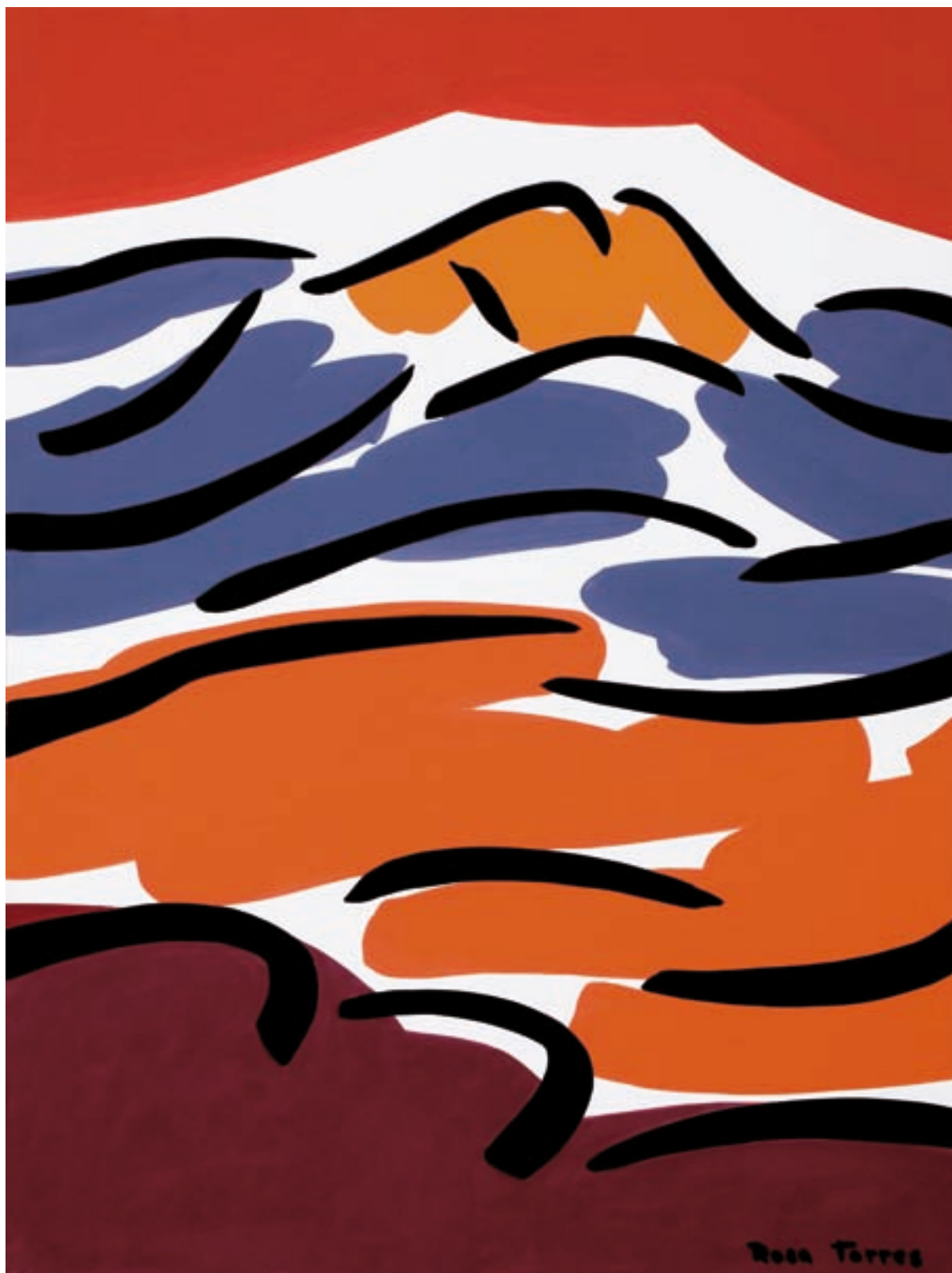
Rosa Torres. Montseny , 2008. Acrílic sobre cartró, 35 x 46,5 cm.