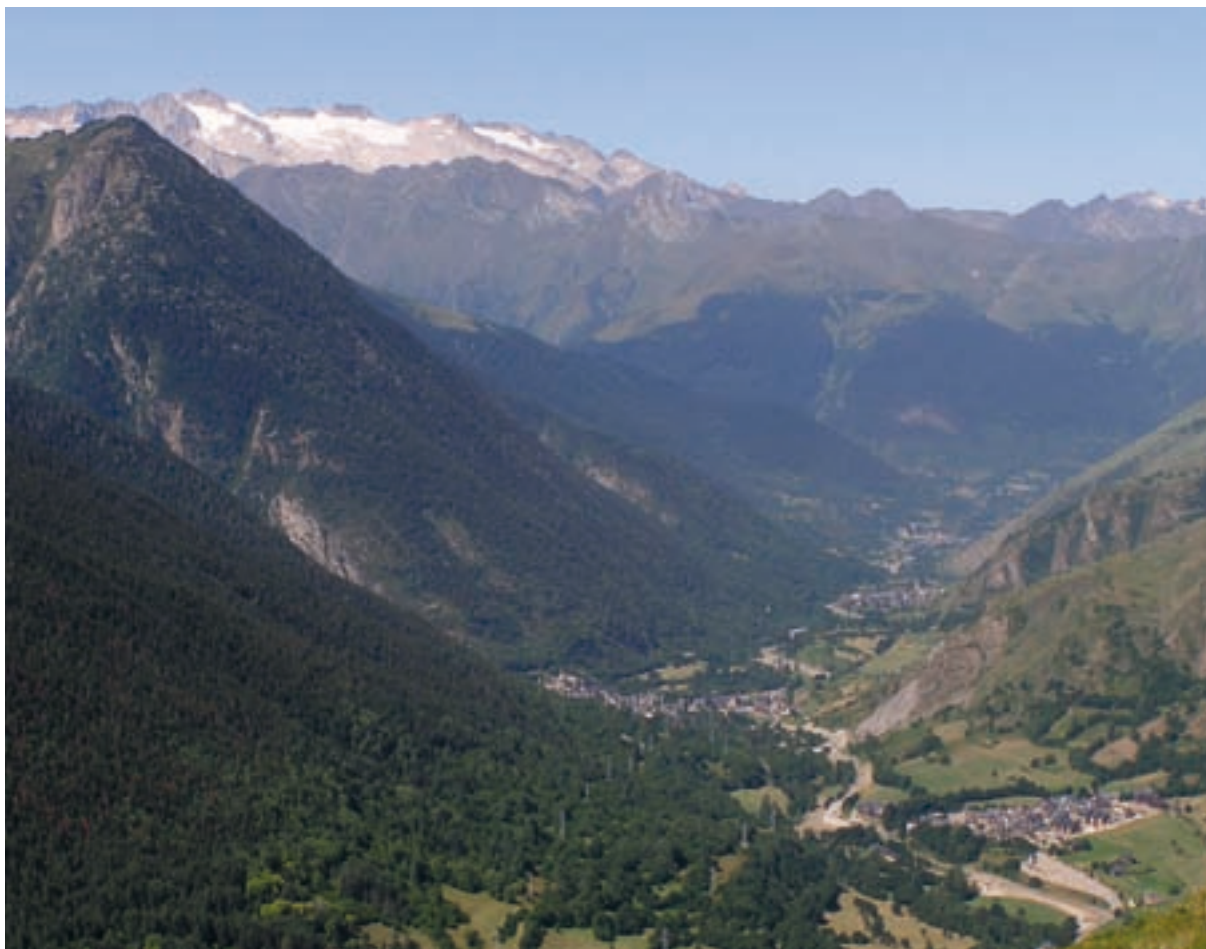
Paisatge de la Vall d'Aran (Alt Pirineu i Aran).

vista. L'experiència obtinguda en els catàlegs de paisatge ha mostrat que els processos participatius tenen potencial per obtenir informació rellevant per a l'elaboració dels catàlegs. Concretament, la participació ofereix l'oportunitat de fer emergir valors del paisatge que serien difícilment detectables a través d'altres vies, detectar les principals inquietuds de la ciutadania i els agents socials vers el paisatge, i difondre i comunicar la tasca de l'administració pública en la protecció del paisatge.