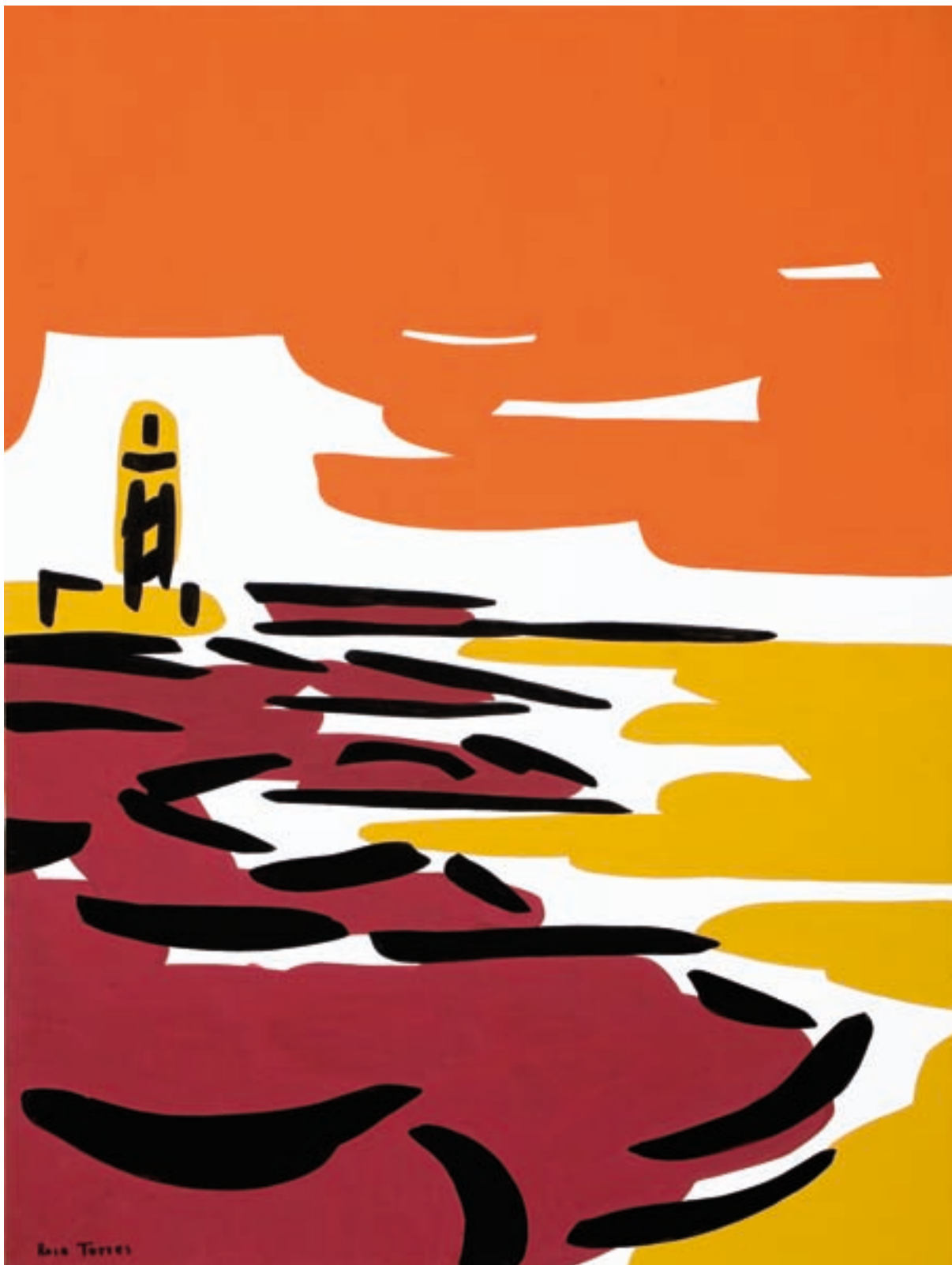
Rosa Torres. Cap de Favàritx , 2008. Acrílic sobre cartró, 50 x 70 cm.