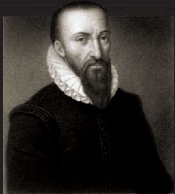
D'esquerra a dreta, Ambroise Paré, Ulisse Aldrovandi i Fortunato Liceto, tres dels autors renaixentistes més significatius de tractats sobre monstres humans.

Considerada globalment, l'anatomia va encetar la construcció d'un saber teratològic arrelat en dades embriològiques i de l'obstetrícia. No obstant això, la pervivència d'una fantasia desbordada i de la tradició que parlava de pobles misteriosos, anatómicament diferents dels occidentals, va desencadenar un ampli debat més enllà de la ciència, que arribava fins al domini de les creences i la religió.