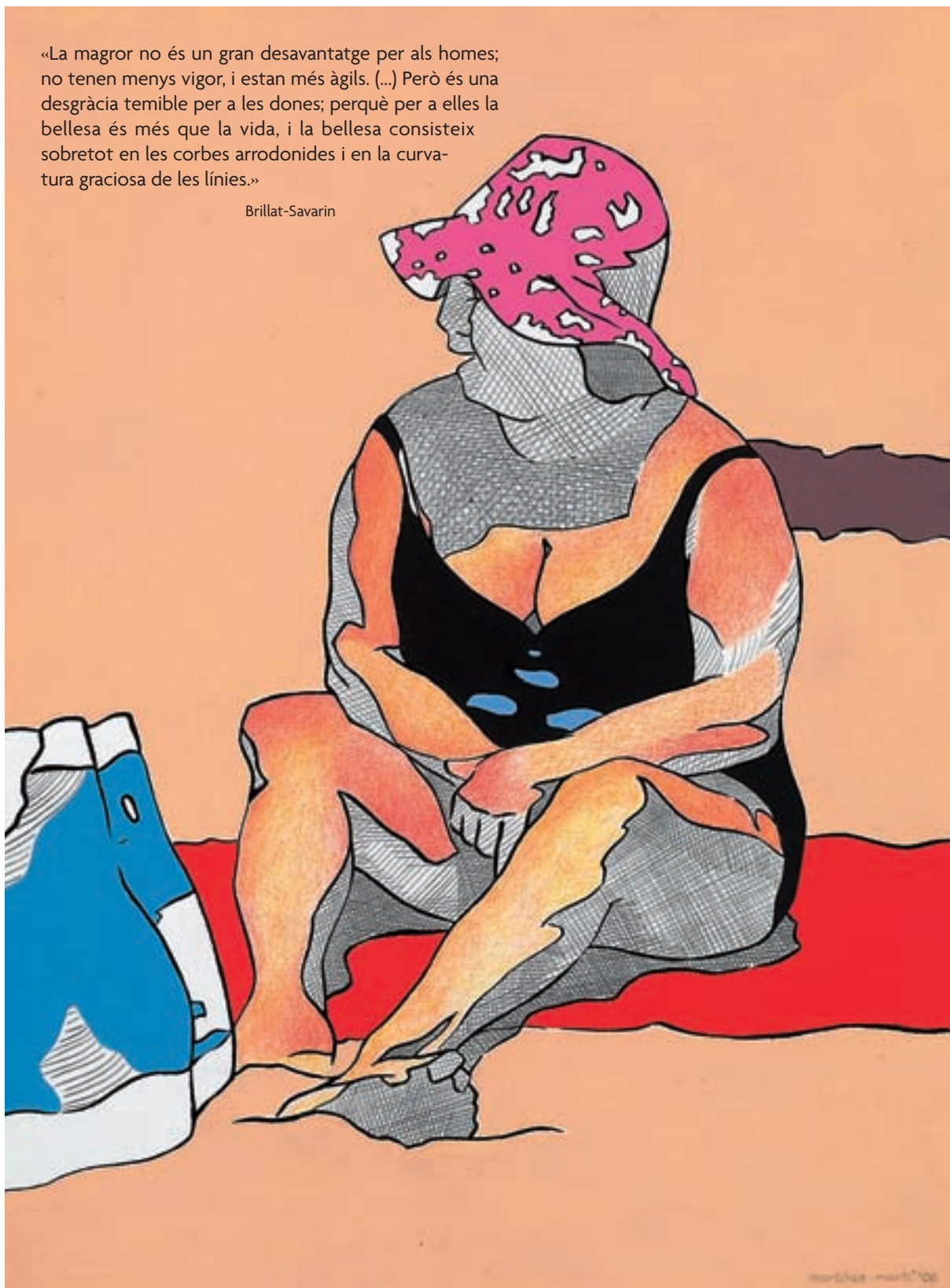
M a Inmaculada Martínez Martí, El paradís il·lustrat , núm. 1, 2006. Tècnica mixta sobre paper, 23 x 31,5 cm.