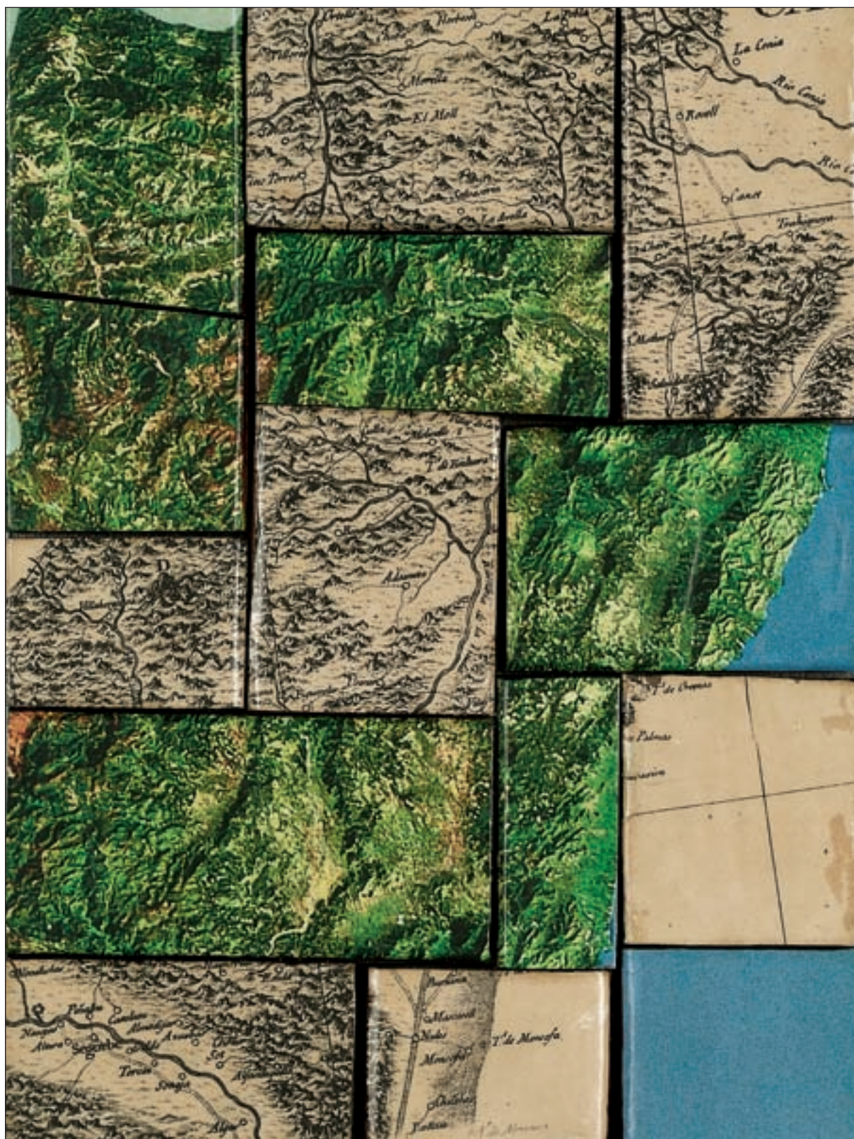
Anna Moner / Sebastià Carratalà. Barreja. Comarques valencianes del nord . Sèrie "Territori". 2007. Impressió digital i tècnica mixta sobre fusta. 16x21,5 cm.