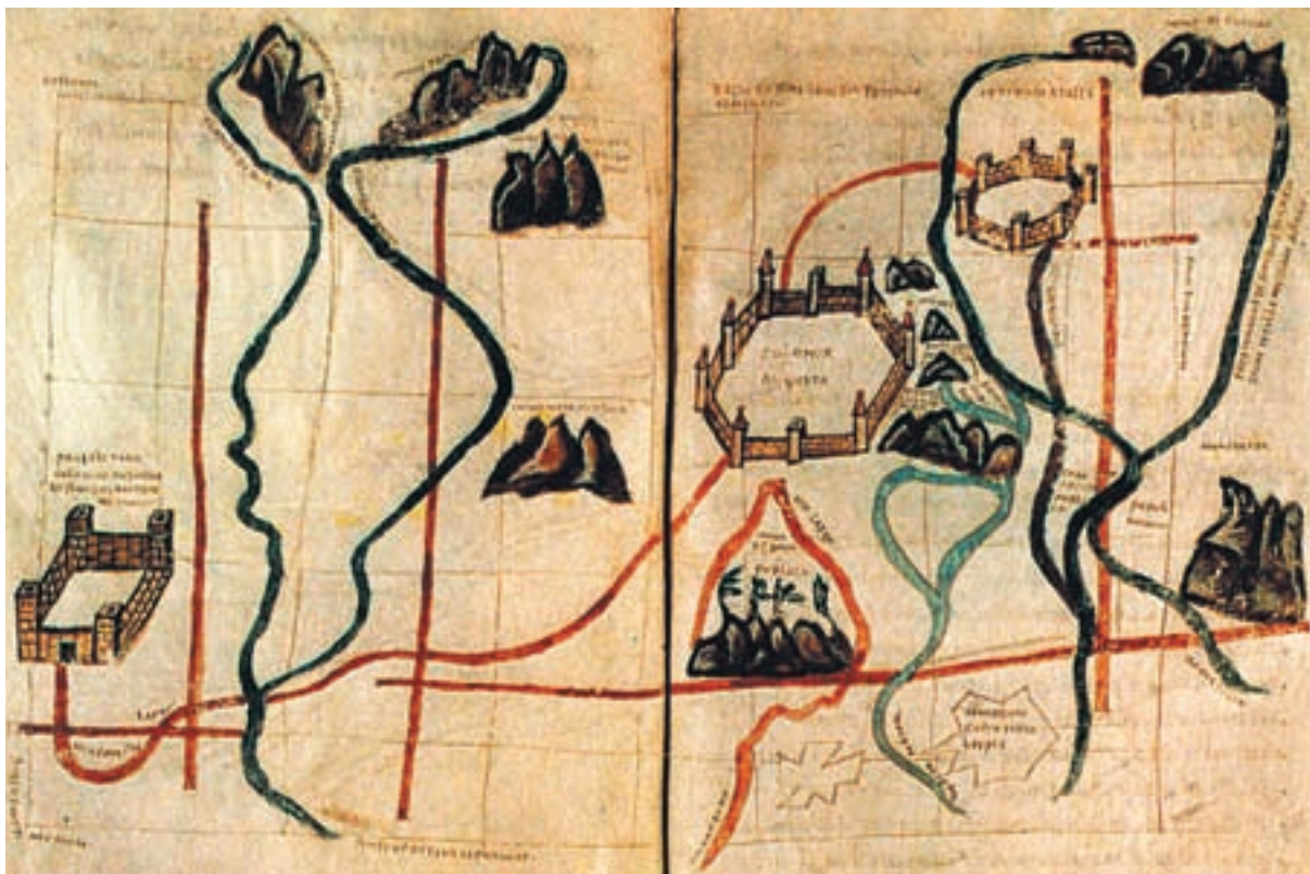
Figura 1. Figura que il·lustra el tractat d'Hyginus Gromaticus, titulada «L'establiment dels limites », segons la còpia del manuscrit carolingi anomenat Palatinus 1564 de la Biblioteca Vaticana. El mapa és una ficció destinada a posar un exemple d'allò que pot ser un esquema que mostre els espais d'una res publica de colons.

compte al mateix temps tant d'un procés de colonització (assignació, agrimensura, partició de terrenys), com d'un procés d'excepció (relació jurídica particular i derogatòria que els colons tenien amb l'espai). Tot plegat ens du a situacions complexes, anomenades amb desenes de mots diferents. En el diccionari de termes i expressions gromàtiques que vaig fer amb Fr. Favory, hi ha més de seixanta entrades del mot ager .