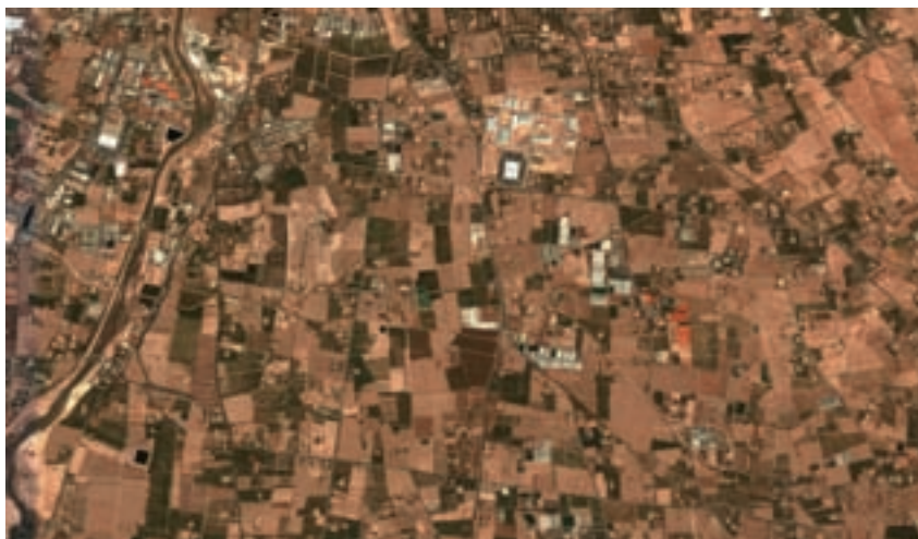
Figura 5. Detall de la cobertura, via satèl·lit, d'Itàlia, a la regió de Cesena, que ens mostra quatre centúries dibuixades encara dins del parcel·lari.