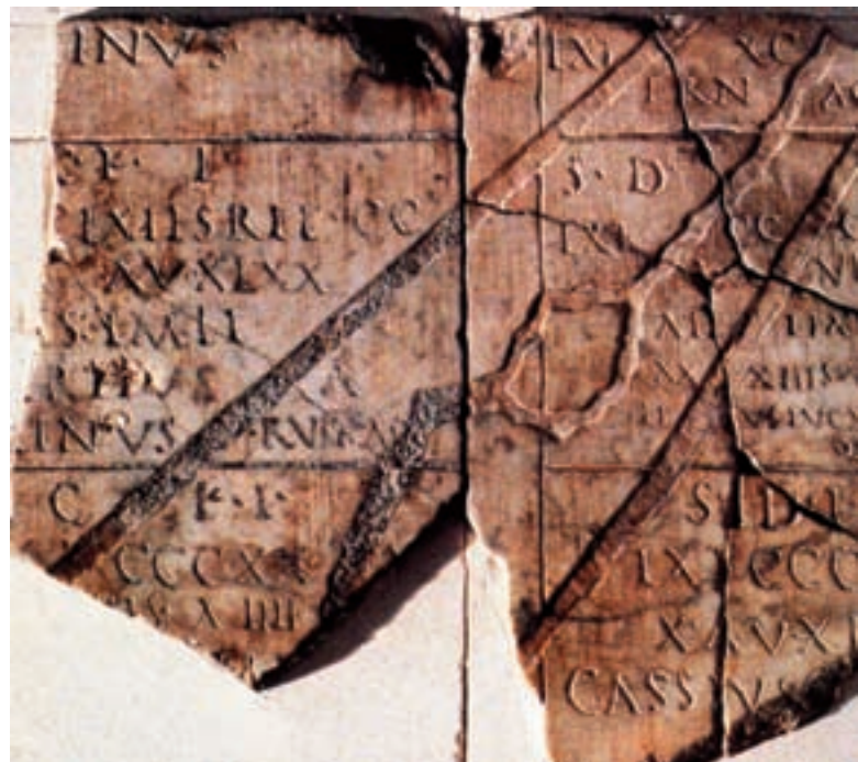
Figura 4. Fragment del plànol cadastral «A» d'Orange, que fa referència a una divisió agrària instal·lada en la regió d'Arles, no gaire lluny de l'emplaçament de l'antiga localitat d'Ernaginum.

Però com que aquests plànols revisats afegeixen unes altres dades, ens donen una idea de què és una forma . A l'altre exemple presentat ací (figura 4), un fragment del plànol més meridional, distingim diferents realitats cadastrals. Al centre, el traçat del kardo maximus (la principal via), al qual s'ha donat una amplitud convencional com a referència. S'assenyalen