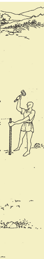
Dibuix: G. Moscarà