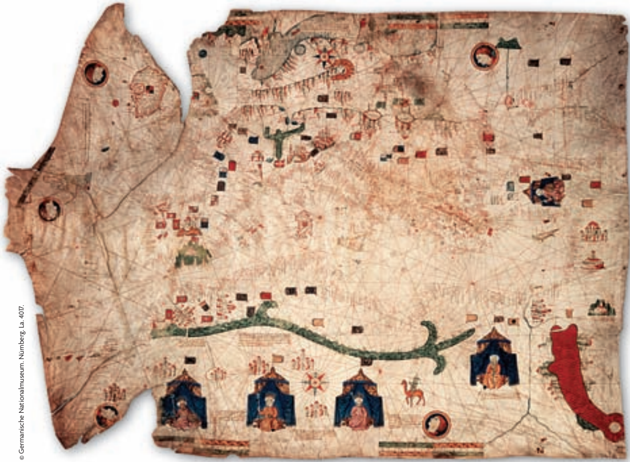
© Germanische Nationalmuseum, Nürnberg, La. 407.