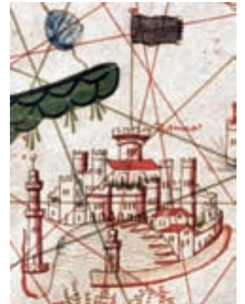
Gènova, P. Rossell (?).

«EL PORT DE GÈNOVA ERA I ÉS EL PORT MÉS IMPORTANT DE LA MEDITERRÀNIA, DESPRÉS DE MARSELLA»