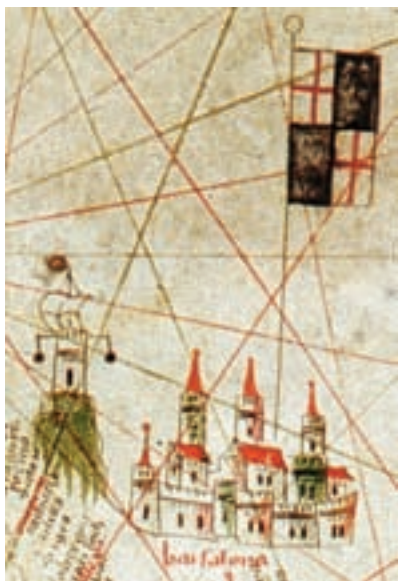
Barcelona, G. Vallseca, 1449.

Els elements definidors de la ciutat de Barcelona a les cartes portolanes són la senyera de la ciutat amb la creu de Sant Jordi i, sobretot, la muntanya i la torre de senyals de Montjuïc. Aquesta muntanya, on hi havia el fossar dels hebreus, era el primer accident orogràfic que s'albirava per mar en apropar-se una nau al port. El fet que alguns cartògrafs medievals foren d'origen jueu pogué contribuir, des del sentiment afectiu, a establir aquest element geogràfic com un tret definidor de la ciutat. Però recordem que està vora el port i que era indefugible en qualsevol representació marítima de Barcelona. L'edifici que els mariners identificaven amb Montjuïc era la torre de senyals del port, amb el sistema d'esferes metàl·liques i banderes que informava de l'arribada i sortida dels vaixells. La primera representació cartogràfica de la torre de Montjuïc la trobem en l'obra de Vallseca, possiblement barceloní, el 1449. Podem veure-hi torres portuàries amb un sistema similar en altres representacions cartogràfiques, com per exemple, les cartes portolanes d'Oлива (1582, 1592). El sistema de senyals, més o menys evolucionat i generalitzat, sobrevisqué en molts ports europeus fins a començament del segle XX. A la ciutat de València encara funcionava a darreries del segle XIX en la torre de la seu per tal d'informar sobre el moviment i la procedència de vaixells. Pel que fa