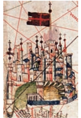
Gènova, B. Beccari, 1435.