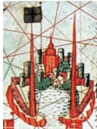
Gènova, J. Bertran, 1456.