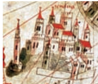
Gènova, G. Vallseca, 1449.