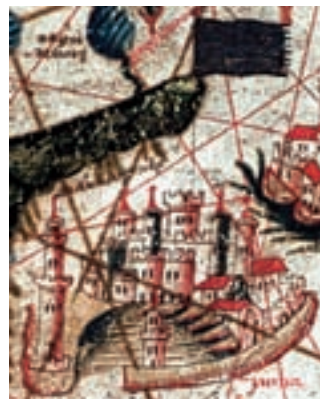
Gènova, P. Rossell, 1465.