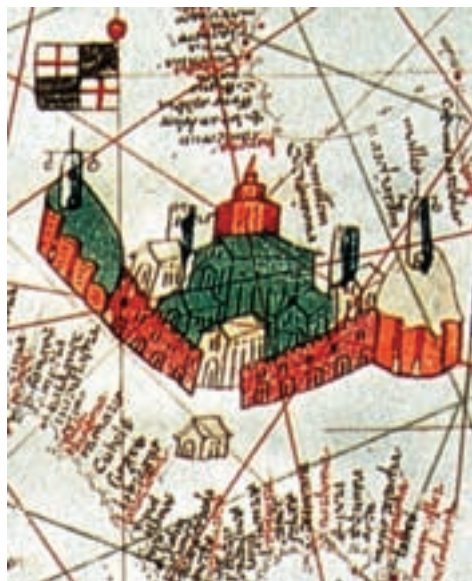
Barcelona, J. Bertran, 1456.