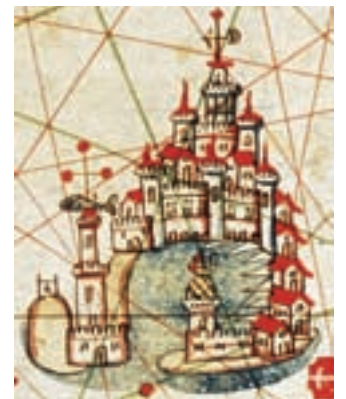
Gènova, J. Bertran, 1489.