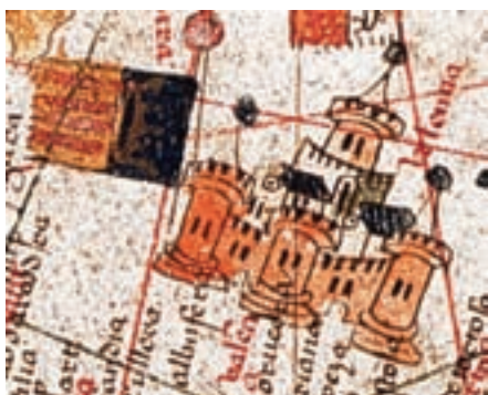
València, autor català desconegut, la meitat s. xv.