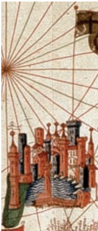
Gènova, P. Rossell, 1449.

«EL PORT DE GÈNOVA ERA I ÉS EL PORT MÉS IMPORTANT DE LA MEDITERRÀNIA, DESPRÉS DE MARSELLA»