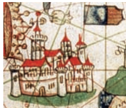
València, J. Bertran, 1489.

a la ciutat comtal, només identifiquem en alguns casos la catedral amb la torre (Bertran, 1456 i 1489) i potser les drassanes (Bertran, 1489).