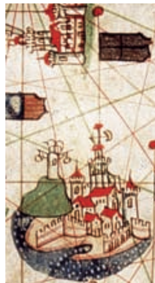
Barcelona, J. Bertran, 1489.