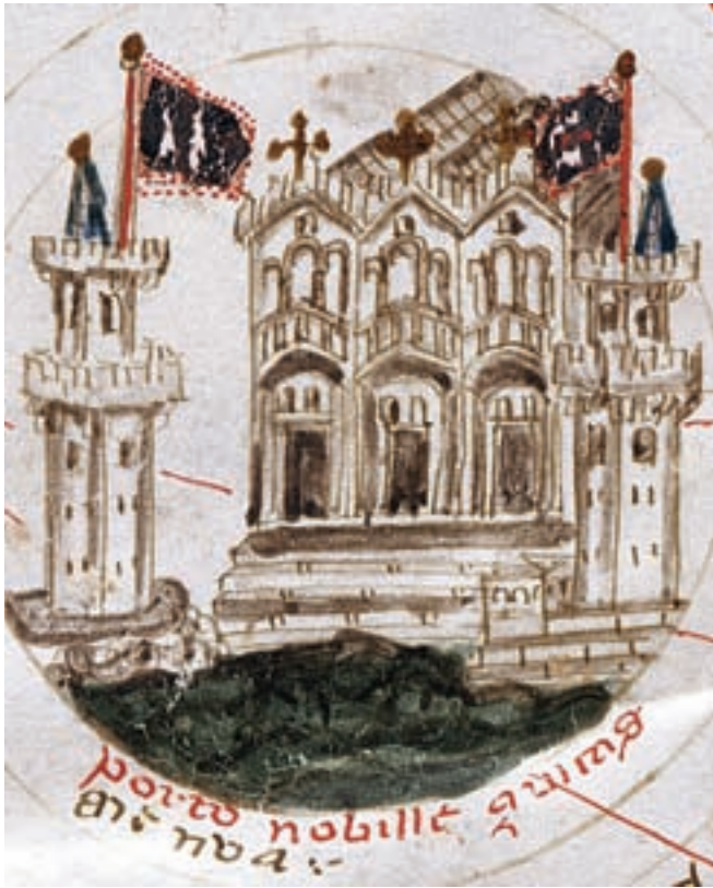
Representació de Gènova en l'atles de Francesco Pizigano del 1373.