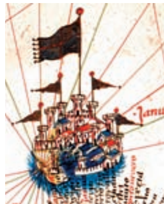
Gènova, G. Benincasa, 1468.