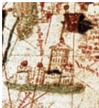
València, March?, 1487.