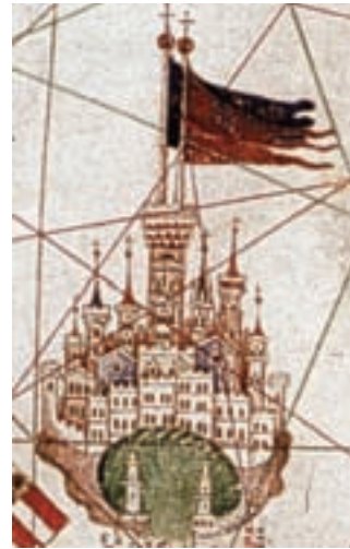
Gènova, F. Beccari, 1403.