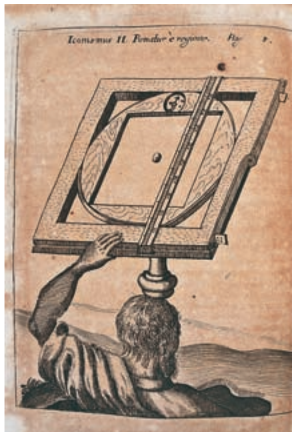
© Biblioteca Històrica UV, Y-8-28, Iconismus II, p. 5

«EL MÈRIT DEL FELIPÓ ÉS EL D'HAYER IMBUÏT ALS “NOVATORES” UN CERT ESPERIT GEOGRÀFIC. LES MATEMÀTIQUES D'ALESHORES ENGLOBAVEN MOLTS ASPECTES DEL CONEIXEMENT CIENTÍFIC I TÈCNIC»