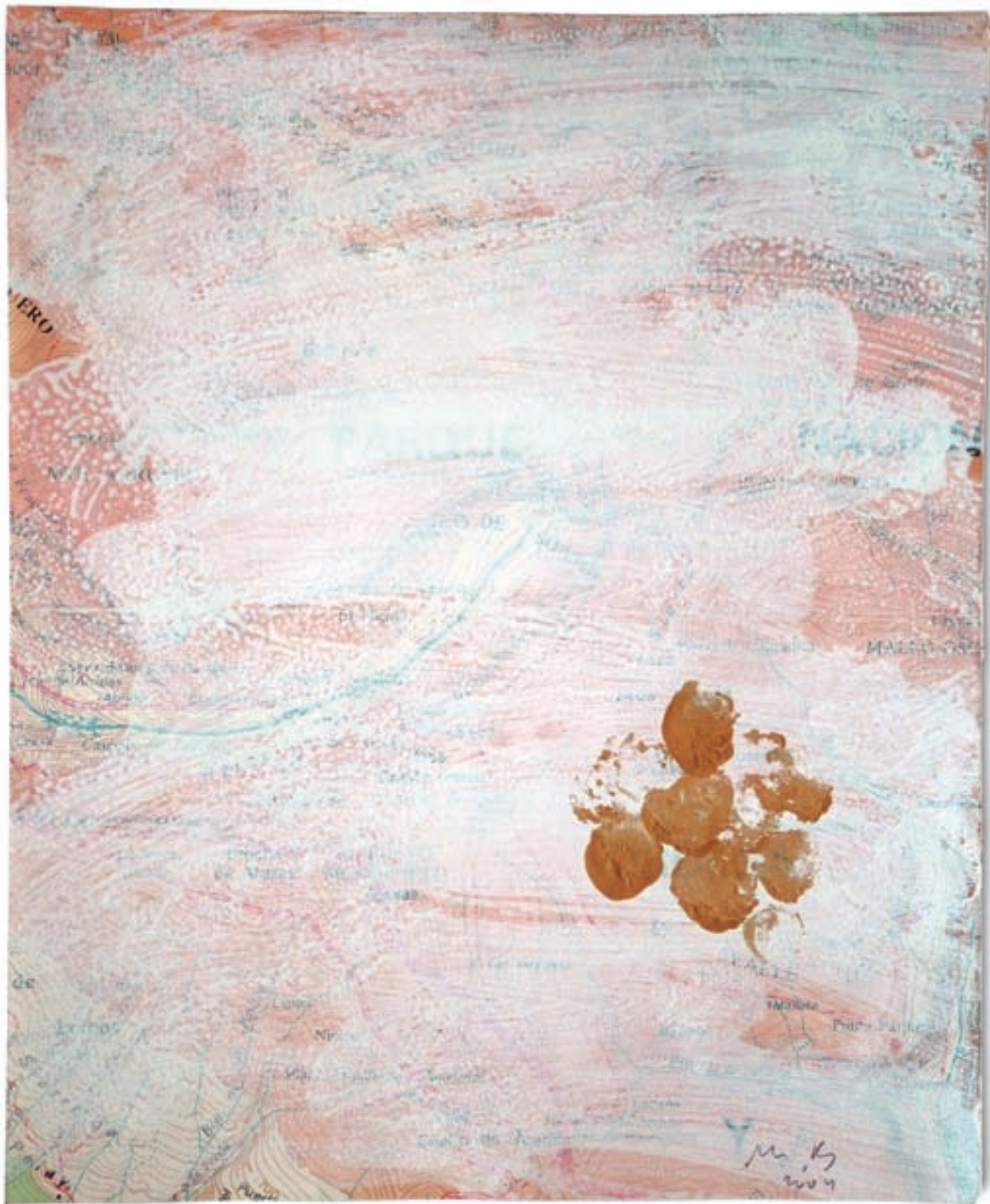
Manuel Bellver. Els fruits de la contemplació (sèrie de 6 dibuixos), 2004. Aiguada i pintura d'or sobre paper imprès en òfset. 21,4x17,5 cm.