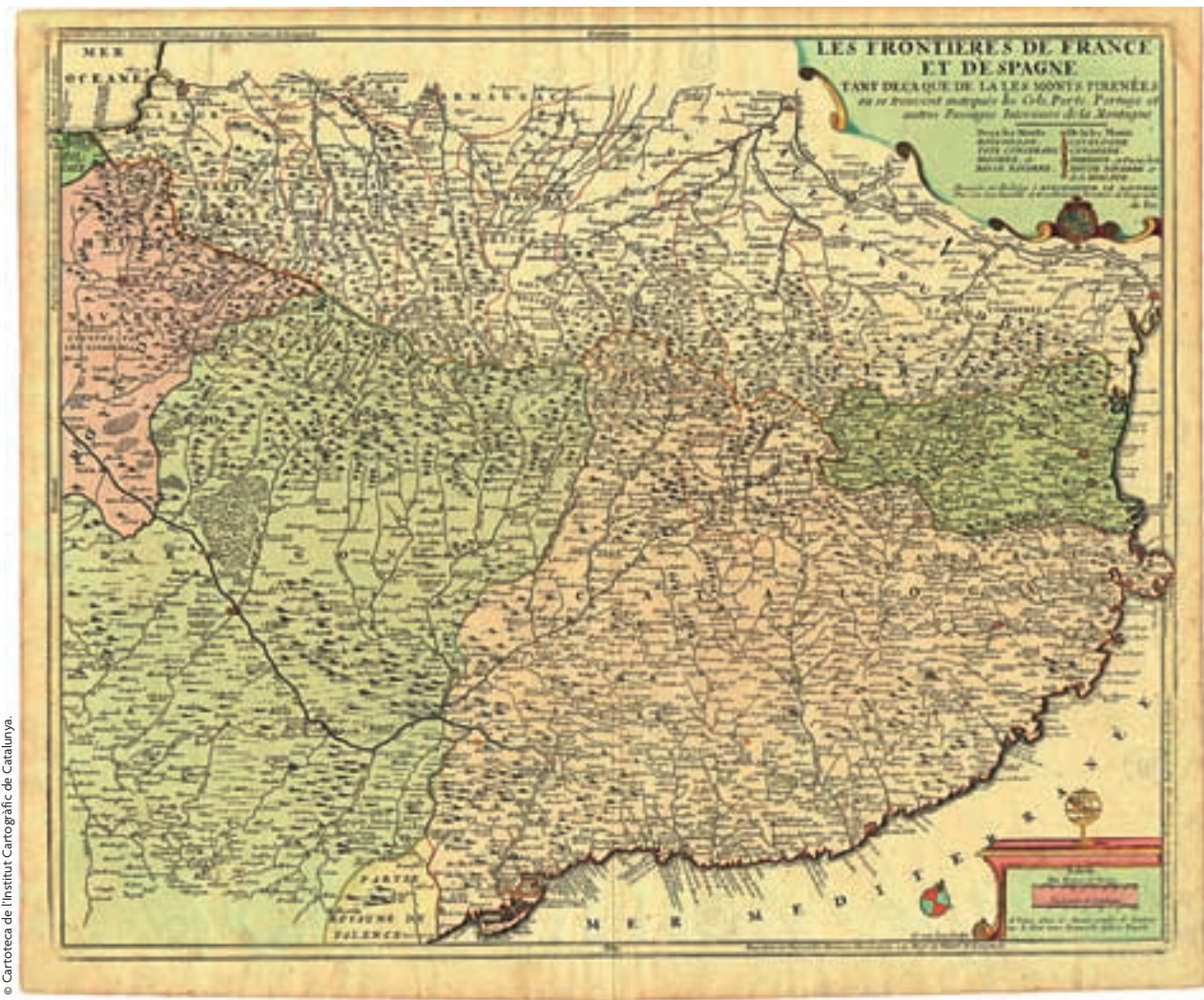
Figura 2. Nicolas de Fer [1694]: Les frontieres de France et d'Espagne tant deça que de la les monts Pirenées... , Paris, G. Danet.

Per a la realització del mapa de conjunt, a escala aproximada 1:216.000, fou necessari el suport de mapes que permetessin situar en un marc geogràfic més ampli la informació dels originals fets a escala gran. Per a l'Aragó, el mapa de Lavanha continuava essent el document bàsic de referència. En el cas de