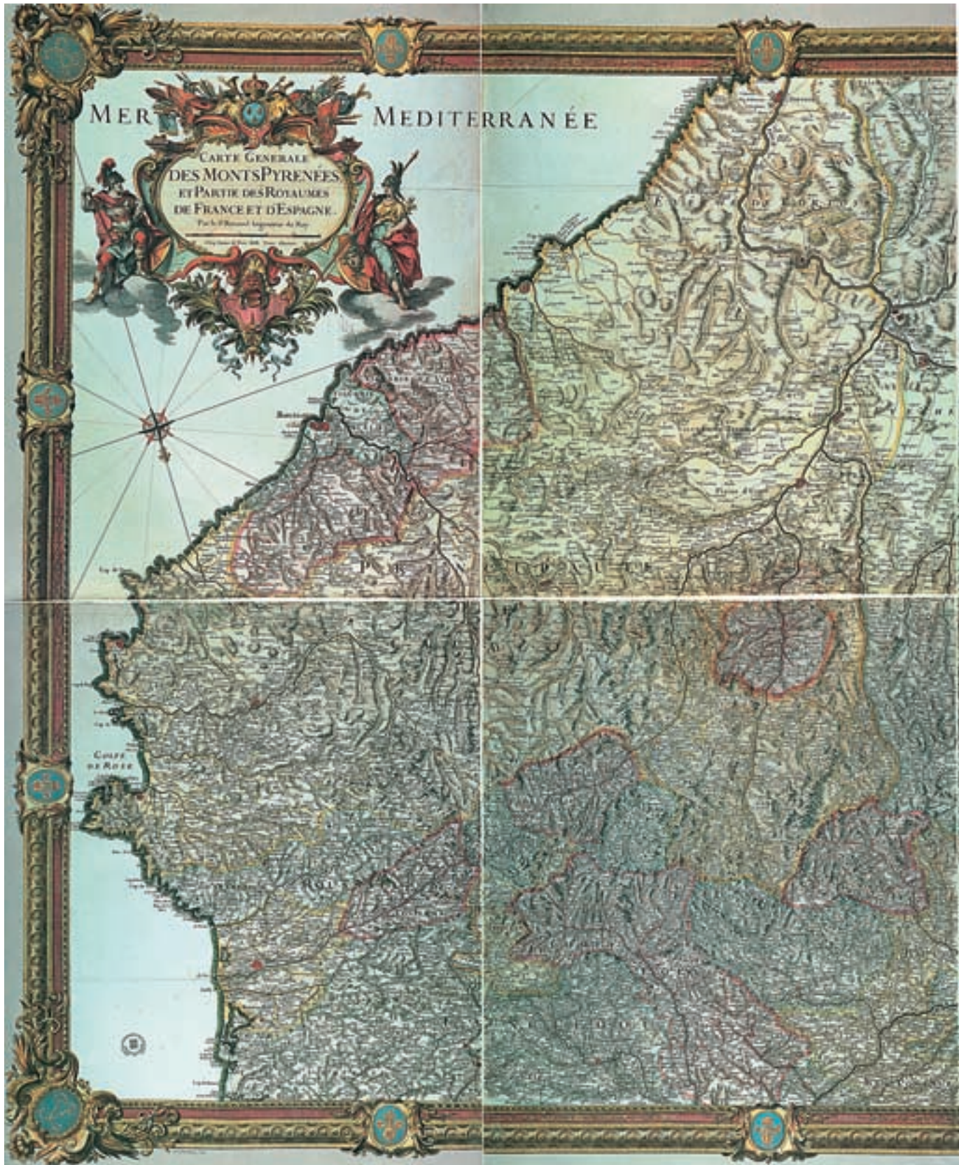
Figura 3. Roussel i La Blotière: Carte Generale des Monts Pyrenées et Partie des Royaumes de France et d'Espagne.