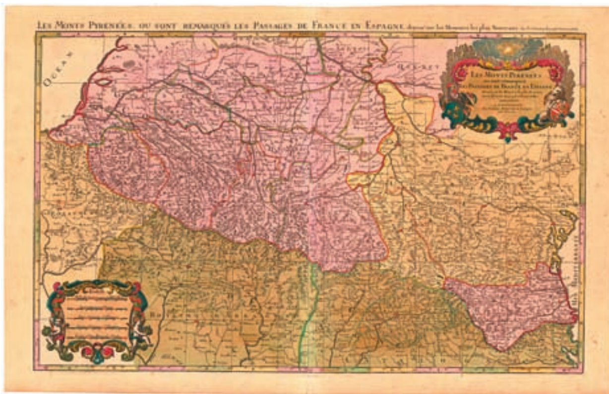
Figura 1. N. Sanson [1675]: Les monts Pyrénées ou sont remarqués les passages de France en Espagne , Amsterdam, Pierre Mortier.