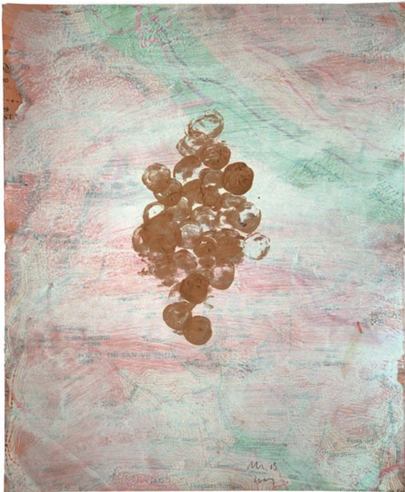
Manuel Bellver. Els fruits de la contemplació (sèrie de 6 dibuixos). 2004. Aiguada i pintura d'or sobre paper imprès en òfset. 21,4 x 17,5 cm.