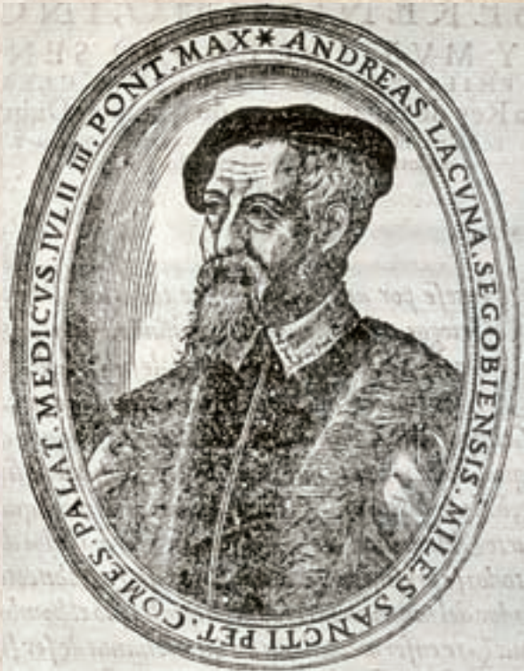
A dalt, retrat d'Andrés Laguna. A la dreta, portada de l'edició de 1566 del seu Dioscorides , obra que durant segles va ser utilitzada a les facultats de medicina com a principal manual de terapèutica.

Cridat pel rector de la Universitat de Colònia, Laguna va ser convidat a pronunciar en l'aula magna de la Universitat una lliçió magistral davant d'un ampli auditori de prínceps, personalitats de la noblesa i de l'elit dirigent, que es va concretar en una oració fúnebre ajustada al ceremonial de difunts, el diumenge dia 11 de febrer de 1543 a les set de la vesprada. Eren moments difícils i de grans tensions polítiques i religioses. L'oració de Laguna va ser publicada amb el títol Europa [...] : hoc est misere se discrucians, suam[que] calamitatem deplorans... (1543), és a dir, L'Europa que miserablement s'atormenta i deplora les seues desgràcies , text d'una trentena de pàgines on dibuixa el panorama desolador d'una Europa devastada per les guerres i les lluites fraticides entre els prínceps.