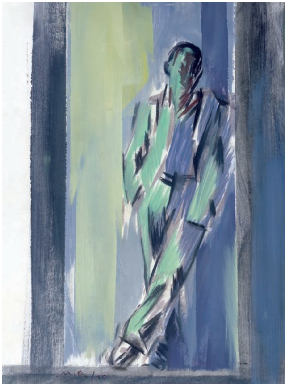
Rafael Martí Quinto. Serie «Naturaleza humana», 2010. Óleo sobre papel, 21 x 29,7 cm.