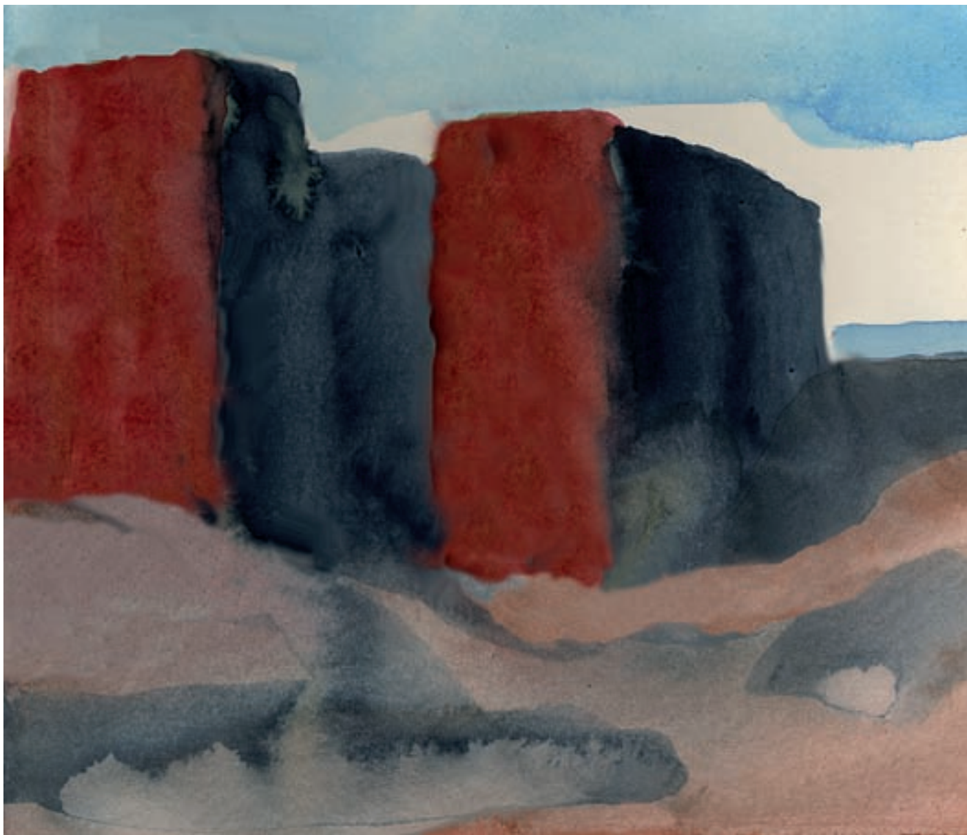
Marcelo Fuentes, 2010. Sèrie «Després de la crisi». Aquarel·la, 16,8 x 13,3.