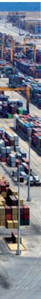
© Ana Ponce & Ivo Rovira

Ara bé, perquè un sistema d'innovació pugui tenir els efectes desitjats sobre la competitivitat empresarial no hi ha prou d'eixamplar els seus components més genuïns –entorn científic, tecnològic, financer i productiu– o millorar les connexions entre aquests mitjançant els mecanismes d'interfície existents (García Reche, 2010). També es necessita un entorn institucional i macroeconòmic favorable, un sistema educatiu que formi professionals adaptats a les necessitats de les empreses; uns mercats de béns i serveis que funcionen eficientment i fomenten la competència empresarial; i un mercat laboral que facilite una adaptació àgil de les empreses a l'evolució del seu entorn econòmic i als canvis en la demanda. En rigor, alguns d'aquests elements són, al seu torn, una premissa bàsica per al desenvolupament d'un bon sistema d'innovació.