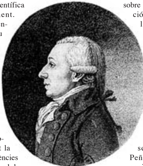
Retrat de Pierre André Méchain.

«UN 19 DE MARÇ DE 1791 L'ACADÈMIA DE CIÈNCIES DE PARÍS APROVA QUE EL “METRE”, LA NOVA MESURA QUE LA FRANÇA REVOLUCIONÀRIA VOLIA DONAR AL MÓN, SERIA LA DEUMILIONÈSIMA PART DEL QUADRANT D'UN MERIDIÀ TERRESTRE»