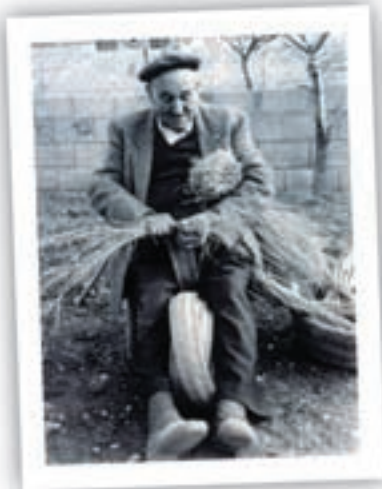
Fent llata d'espart a Biar.