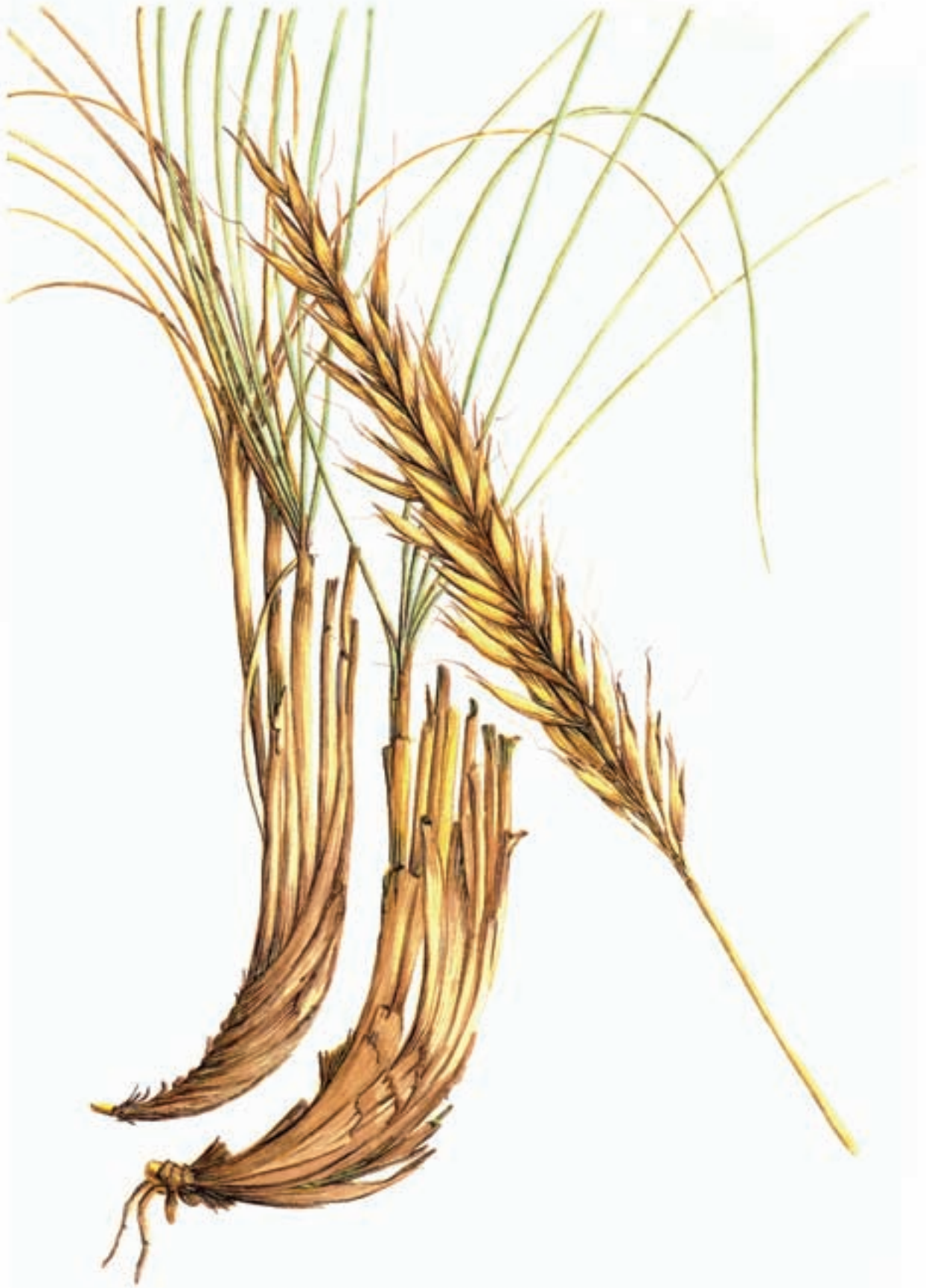
Stipa tenacissima L.