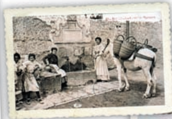
Dalt, sàries d'espart i cistelles de vímet a la font dels Algepsars d'Alcoi a l'inici del segle xx (Col·lecció Museu Arqueològic Municipal d'Alcoi Camil Visedo). A la dreta, cadira de boga i cadira d'espart a Olocou (Col·lecció Museu de Prehistòria i de les Cultures de València).