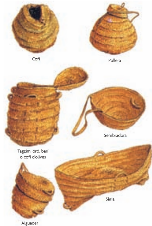
Artefactes d'espart, dibuix de X. Fornés i Llodrà (Barber, 1997).

tiques substituïen l'espart. La producció d'Albacete el 1970 fou tan sols de 4.600 tones en 12.600 hectàrees. Per aquells anys al territori valencià es collien poc més de 15.000 hectàrees d'espartars. El total de la producció nacional de 1985 va ser de 5.832 tones i ha continuat després a la baixa: 38 tones el 1996 i 605 l'any següent. Actualment és una producció marginal i s'ha d'importar espart magribí.