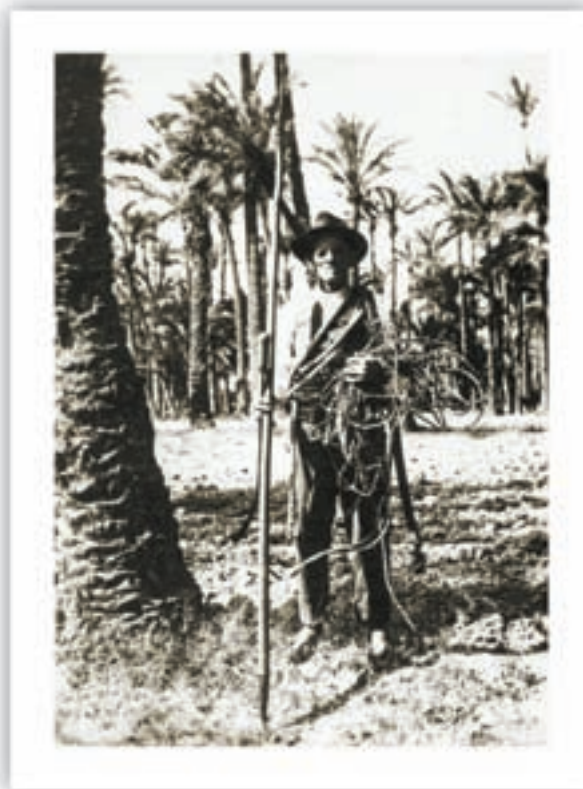
Palmerer d'Elx amb estris d'espart, cap a 1940.

En època islàmica continua l'elaboració de cordam exportat pel port d'Alacant i s'hi afegeix la fabricació