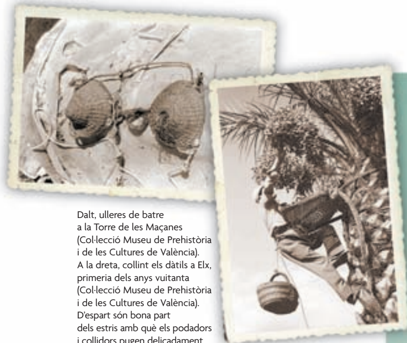
Dalt, ulleres de batre a la Torre de les Maçanes (Col·lecció Museu de Prehistòria i de les Cultures de València). A la dreta, collint els dàtils a Elx, primeria dels anys vuitanta (Col·lecció Museu de Prehistòria i de les Cultures de València). D'espart són bona part dels estris amb què els podadors i collidors pugen delicadament a la palmera.

tarius, tot i això, continuava sent un element fonamental en l'economia de moltes localitats i famílies. Així el ferrocarril Alcoi-Villena-Iecla (1884), perllongat després a Jumilla i Cieza, rebia, entre altres noms, el del "tren de l'espart". Altres comarques valencianes també destacaven. Al Mont número 13 d'Utilitat Pública de Portaceli –corresponent a l'antic priorat de la cartoixa de Porta-Coeli (Serra)– es collien a la dècada dels anys vint del passat segle una important mitjana de 34.000 kg anuals que es transformaven a Bétera, Lliria i altres pobles propers.