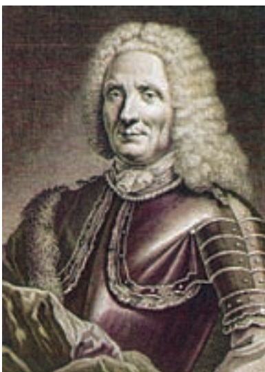
Benoît de Maillet va imaginar que els ocells provenien dels peixos.

Amb això, la ciència ha anat avançant a poc a poc. Els viatges a la Lluna de Jules Verne ja no sobten ningú, però en el seu moment varen semblar total-