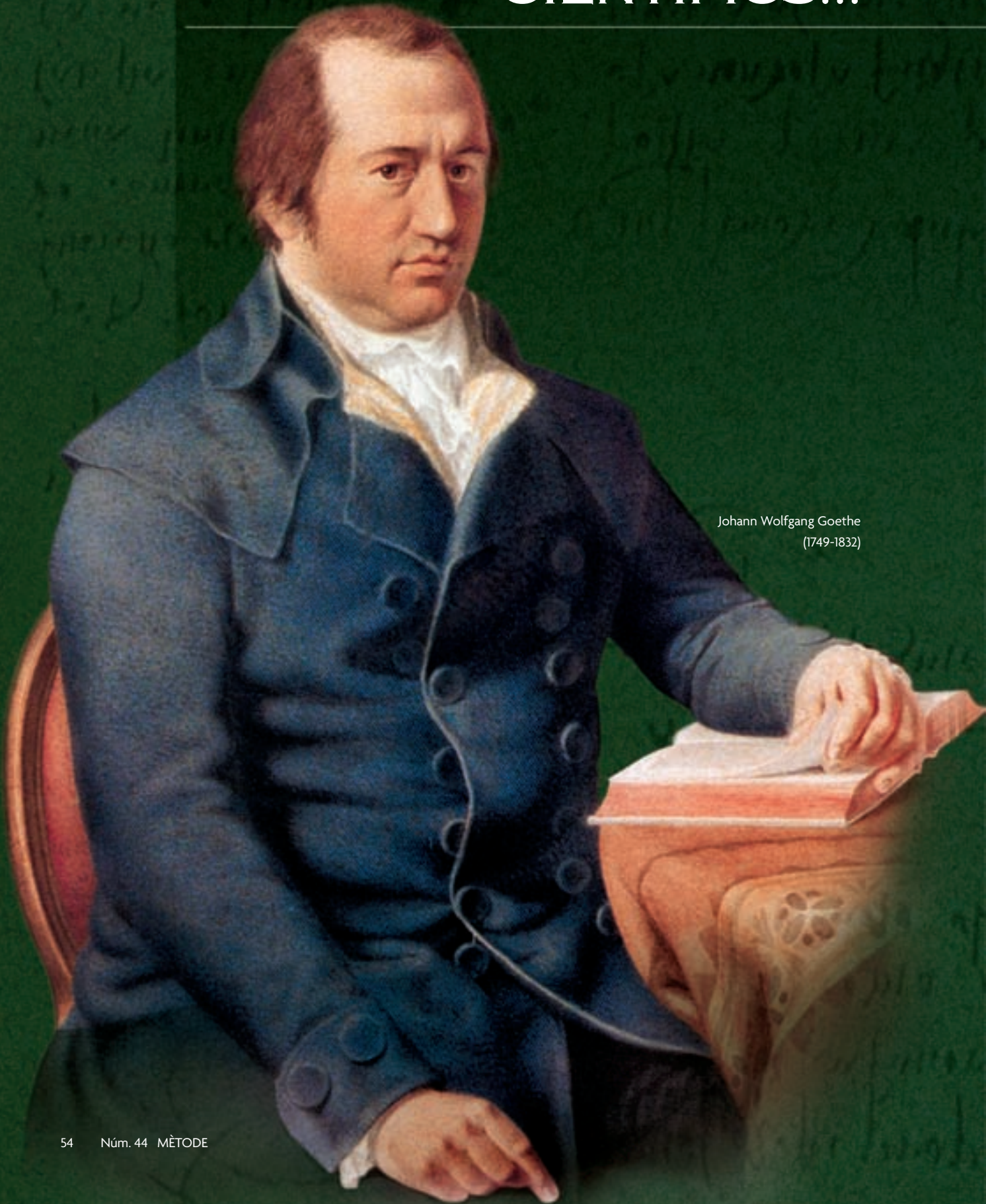
Johann Wolfgang Goethe (1749-1832)