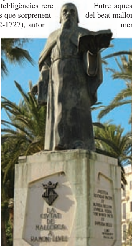
Estàtua de Ramon Llull prop del palau de l'Almudaina, a la ciutat de Mallorca.

El primer és que possiblement Newton era coneixedor de la llegenda protagonitzada per Ramon Llull tres segles abans. En un dels seus nombrosos viatges, el "mestre" mallorquí va recalar a la cort del rei britànic i va prometre a Eduard d'Anglaterra facilitar la suma d'or que li demanaren per tal de finançar una nova croada a Terra Santa. Si aquesta es portava a terme, ell es comprometia a explicar tots els detalls del procés alquímic. Amb més eficàcia que la majoria dels protagonistes d'altres històries, als pocs dies de tancar-se hermèticament a la Torre de Londres, va operar la transmutació i hi va obtenir una quantitat extraordinària d'un or d'excel·lent qualitat, amb el