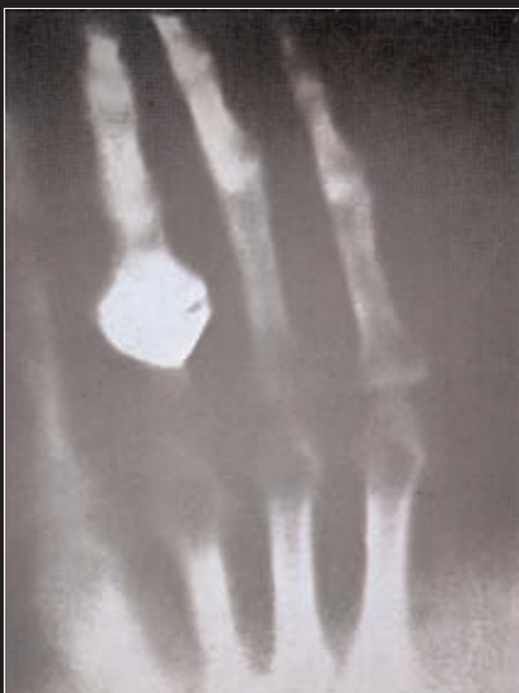
Els primers raigs X: una imatge de les mans de la dona de Wilhelm Röntgen on es pot veure l'anell que portava a la mà.

científica i molt particularment del món mèdic. Igual com succeïa en aquella mateixa època amb la fotografia o amb els primers passos del cinematògraf, la troballa es va comercialitzar de seguida i va ser un famós constructor d'instrumental científic, E. J. Marey, qui va començar a fabricar aparells que tenien una aplicació directa en l'exploració clínica.