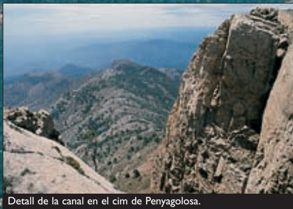
Detall de la canal en el cim de Penyagolosa.