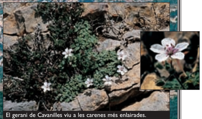
El gerani de Cavanilles viu a les carenes més enlairades.