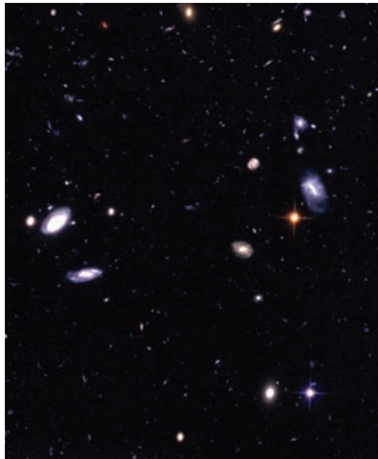
Fragment de la imatge de l'Ultra Deep Field, presa pel telescopi espacial Hubble i publicada el 2004. S'hi observen centenars de galàxies a les distàncies més llunyanes mai observades.