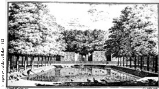
Imagen extraída de Baker, 1952

Trembley, pescando Daphnia en un estanque de peces en Sorgvliet. El naturalista observó el pólipo en un estanque y sintió una gran curiosidad.