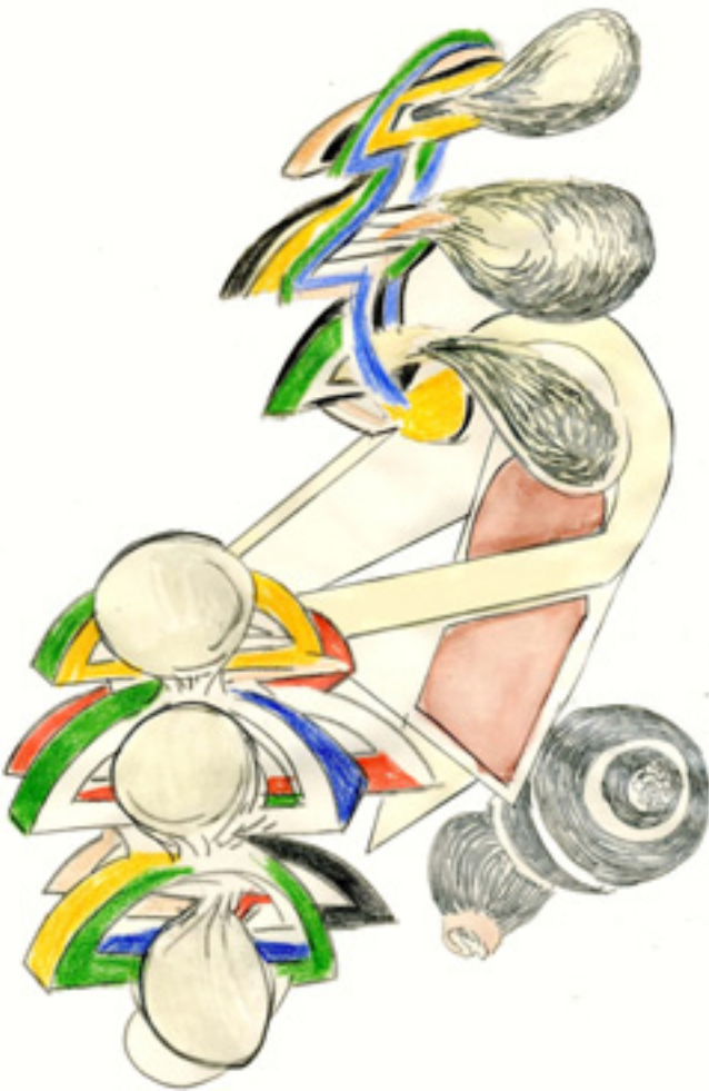
Julio López Tornel. Sin título (tríptico, fragmento), 2012. Técnica mixta sobre papel, 29,7 x 42 cm.

«SE ENTENDÍA QUE LA FORMA COMO SE REGENERABA EL PÓLIPO CERTIFICABA QUE LA MATERIA ERA UNA ENTIDAD DINÁMICA Y NO SOLAMENTE PASIVA»