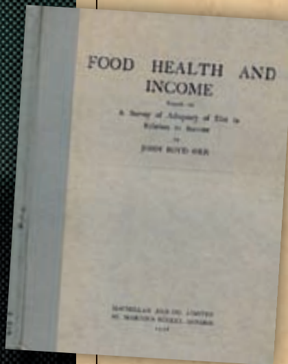
A l'informe Food, Health and Income (1936) Boyd Orr revelava que un terç de la població britànica mostrava signes de desnutrició crònica.

menys ingressos. Una política a llarg termini havia de conciliar els interessos de l'agricultura, el comerç i la salut pública, la qual cosa només era possible si la producció es coordinava a escala mundial. El WFB acceleraria l'expansió agrícola, la mecanització i ampliaria el mercat d'equipaments, adobs i instal·lacions vinculades a la conservació i el transport, el que contribuiria a la consecució dels objectius humanitaris proclamats per les Nacions Unides.