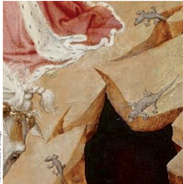
The Art Institute of Chicago