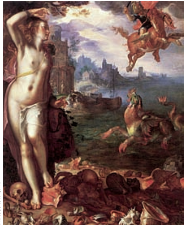
Museu del Louvre, París

«FINS I TOT NARRACIONS TAN POPULARS COM LA LLEGENDA DE SANT JORDI, QUE PODRIA SEMBLAR GENUÏNAMENT CATALANA, TENEN L'ORIGEN EN LA MITOLOGIA GREGA»