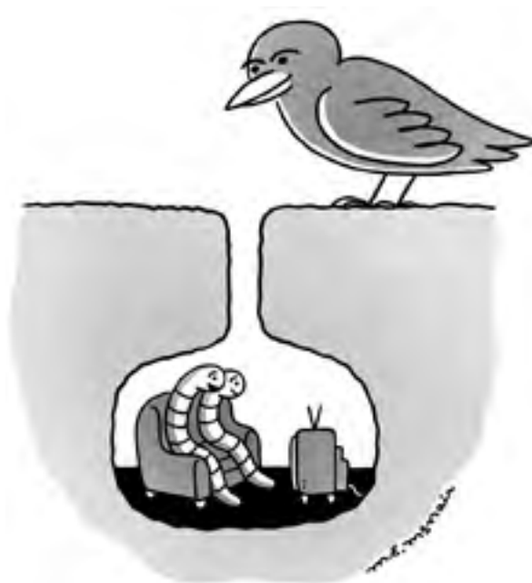
Figura 1. En la vinyeta de Elizabeth McNair, publicada en The New Yorker l'11 de maig de 2020, el virus apareix conceptualitzat com un ocell depredador disposat a menjar-se els cucs quan isquen de sa casa.

Si bé la crítica a l'ús del llenguatge bèl·lic esmentada amb anterioritat ha abordat fonamentalment com els actors polítics han explicat la pandèmia a la societat, alguns dels usos més creatius de metàfores alternatives recollides en la base de dades col·laborativa #ReframeCovid (Olza, 2020) provenen d'altres fonts. Entre aquestes són particularment interessants les vinyetes, que es poden entendre com la resposta visual i amb freqüència humorística a l'actualitat. A través de l'humor, en aquestes vinyetes es mostra no sols la realitat del virus sinó també una avaluació de la gestió política de la pandèmia. Diversos estudis relacionats amb l'ús metafòric en les vinyetes han explorat aquesta capacitat avaluativa (Domínguez, 2014; 2015) en la qual influeixen el posicionament de l'autor i també el coneixement compartit amb la seua audiència. Moltes d'aquestes