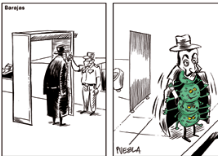
Figura 2. Un ús freqüent de la metàfora en les vinyetes consisteix en la visibilització del virus mitjançant la seua equiparació amb una persona, un animal, una força de la naturalesa o fins i tot un monstre o un alienígena. Així s'emfatitza la seua existència i perillositat. A dalt, vinyeta de Puebla titulada «Barajas. Todo controlado», publicada en el diari ABC el 13 de juliol de 2020.

Encara que les referències a les ones i tsunamis són habituals per a descriure l'activitat política de Donald Trump (Daryl Cagle, 28/03/2020; John Cuneo, The New Yorker , 8/07/2020), és particularment interessant l'equiparació entre la COVID-19 i un volcà