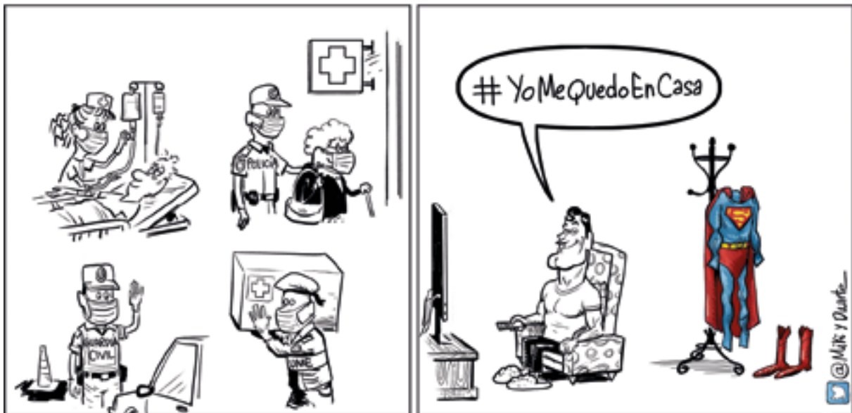
Figura 4. La metàfora adquireix una càrrega positiva quan són els sanitaris els que s'enfronten a un estira-i-arrotonsa amb el coronavirus. Així, altres usos metafòrics que s'han trobat per a emfatitzar el reconeixement als treballadors essencials, principalment els sanitaris, han estat la seua conceptualització com a àngels o superherois. A dalt, vinyeta de Miki i Duarte publicada en el Diario de Sevilla el passat 28 de març de 2020.

Particularment interessants són els usos metafòrics combinats amb referències intertextuals, que emfatitzen