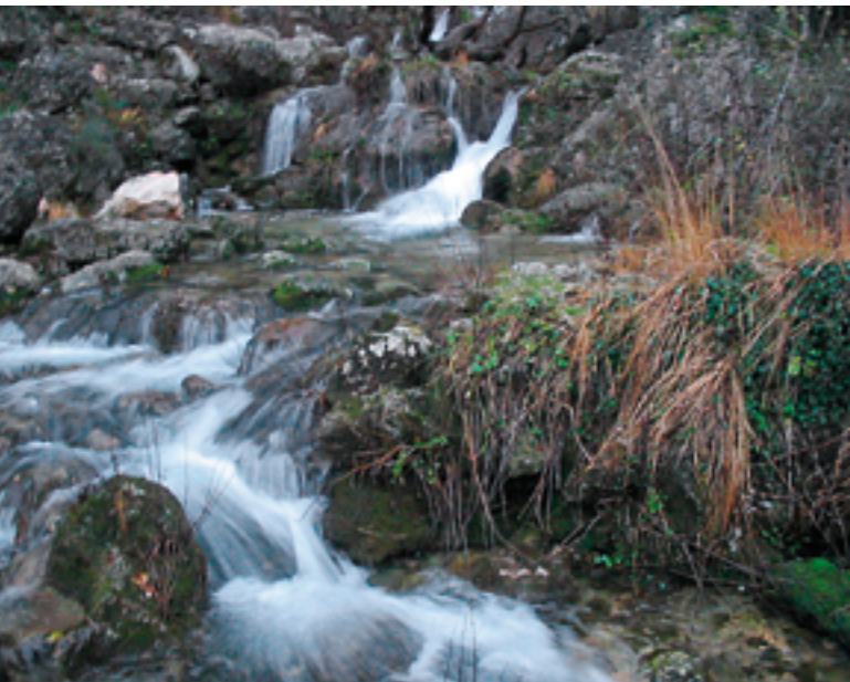
Juan Fernández CC BY-SA 2.0

En la natura, ens trobem davant d'un objecte que no sempre està perfectament delimitat, ni la seva forma es presenta de manera fixa i immutable. En la imatge, naixement del riu Mundo, a Albacete.